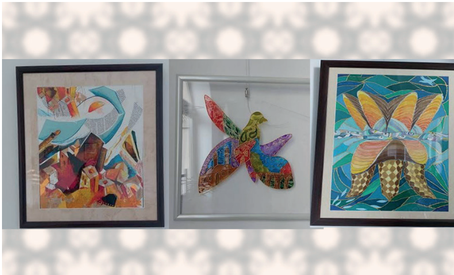
İLL 4. Kollaj

4. Artikulyasiya. Bu mərhələdə şagirdlər təsviri sənət fənninin tədrisi metodikasında ahəng və ardıcılıqla bir neçə işi yerinə yetirir. Müxtəlif fəaliyyətləri birləşdirərək şagird eyni zamanda müvafiq ardıcılıqla, dəqiqlik və sürətlə təsviri sənət üzrə tapşırıqları icra etməlidir. Bu mərhələdə şagird həmçinin bacarıq və ya məhsulu yeni vəziyyətlərə uyğunlaşdıraraq dəyişdirir. Kollaj haqqında şagirdlərə məlumat verdikdən sonra müəllim bu üsulu əyani şəkildə şagirdlərə icra etməyi tapşırmalıdır. Təsviri sənət fənnində mövzuları keçəndən sonra müəllim şagirdlərə video-çarx hazırlamağı tapşırıraq, fənnə qarşı maraq oyada bilər.