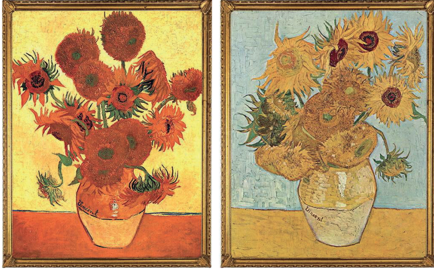
İLL 3. Vinsent Van Qoq “Günəbaxanlar”

öyrəndiyi bilikləri şagirdlərə “Günəbaxan” əsəri üzərində tətbiq etməyi tapşırıraq bu mövzunu onların yaddaşında möhkəmlədə bilər. Dəqiqlik mərhələsində müəllim təsəvvürünə uyğun natürmort çəkməyi də xüsusilə ibtidai sinif şagirdlərinə tapşırıraq həm də bu janr barəsində həm nəzəri, həm təcrübi biliklərini inkişaf etdirə bilər.