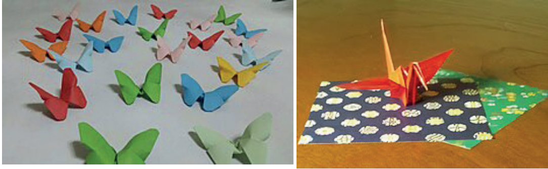
İLL 1. Oriqami

müəllim lövhəyə yazaraq şagird tərəfindən onu təkrarlamağı tapşırmalıdır. Aşağı sinif şagirdlərinə oriqami hazırlayarkən müəllim onları ətrafına yığaraq işin bütün prosesini başa salır və sonra şagirdlərə onu icra etdirməklə uğurlu imitasiya psixomotor taksonomiyanı tətbiq edə bilər.