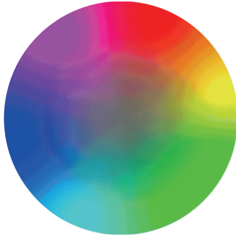
İLL 5. Rəng münasibətlərini özündə birləşdirən daire

5. Təbiiləşmə. Təsviri sənət fənninin tədrisi metodikasında bu psixomotor taksonomiya şagirdlərdə hərəkətləri avtomatik, intuitiv və ya avtomatikleşmiş şəkildə yerinə yetirmək qabiliyyətidir. Başqa sözlə desək, şagird bir və ya bir neçə bacarığı asanlıqla yerinə yetirərək, avtomatikleşdirilmiş formada icra edir. Bu mərhələdə bacarıq artıq vərdişə çevrilmiş olur. Şagirdlər psixomotor taksonomiya sahəsinin bu mərhələsində dizayn, ixtira etmək kimi mükəmməl bacarıqları icra edir. Şagirdlərə rəng həllini mükəmməl şəkildə yerinə yetirmək üçün müstəqil tapşırıqlar verə bilər. “Dizayn” mövzusunda keçəndən sonra müxtəlif konstruksiyaları icra etmək, düzəltmək kimi mühüm qabiliyyətlər şagirdlərdə təbiiləşdirilə bilər.