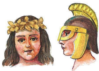
İLL 2. Antik üslub

Şagirdlər “Avropa baş geyimləri” mövzusunda müxtəlif dövrlərdə geyim dəstinin çox mühüm tərkib hissələrindən baş geyimləri olması barəsində məlumat öyrənirlər. Antik dövrdə baş geyimləri praktik əhəmiyyət daşıyaraq, ancaq döyüşçülərin dəbilqəsi qoruyucu funksiya ilə yanaşı, həm də mərdlik rəmzi sayılırdı. Orta əsrlərdə və sonrakı dövrlərdə baş geyimləri ilk növbədə bəzək əşyası və var-dövlətin təcəssümü hesab olunurdu.