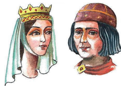
İLL 4. Roman üslubu

VII sinif şagirdləri “Geyimin cəmiyyətdə rolu” mövzusunda tarixi üslublar haqqında məlumat öyrənirlər. Antik üslubda olan geyim şaquli qırçınlardan, ayaqqabı isə yalnız altlıq və qaytanlardan ibarətdir. Bizans geyimləri isə Şərqi xas olan dəbdəbəli və çox bahalı materiallardan istifadə olunması ilə diqqəti cəlb edir. Roman geyimi antik irsin daşıyıcısı olsa da, ona çoxlu əlavə edilmişdir. Sadə və geniş paltarlar enli xətlər – naxışlı haşiyələr vasitəsilə bəzədilmişdir. Şaquli xətlərin və iti bucaqların çoxluğu həm memarlıqda, həm də geyimlərdə qotik üslubun ən mühüm cəhətlərindən sayılır. İntibah