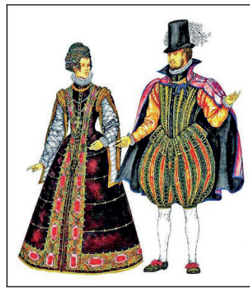
İLL 6. İntibah geyimləri

Dərslərdə "Azərbaycan baş geyimləri" mövzusunda şagirdlər ilk növbədə cəmiyyətdəki mövqeyindən asılı olmayaraq, papağın kişilər üçün mərdlik, şərəf və ləyaqət simvolu sayıldığını öyrənirlər. Keçmişdə papağın formasına görə onu daşıyanın cəmiyyətdəki mövqeyini və sosial vəziyyətini müəyyən etmək olardı. Cəmiyyət arasına, ictimai yerlərə baş geyimi olmadan getmək ədəbsizlik sayılırdı. Kişi papaqlarının əsasən, uzun və yumşaq tükləri olan qoyun dərisindən, yaxud qaragüldən (quzu dərisi) hazırlandığı barəsində illüstrasiyalardakı obrazlarda təqdim edilmişdir. Həmçinin mövzuda araçın, şal və kəlağayı haqqında məlumat verilmişdir.