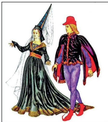
İLL 5. Qotik geyimlər

dövrünün geyimləri simmetriyanın olması və üzərindəki bər-bəzəyin azlığı ilə diqqəti cəlb edir. Bu geyimlər bahalı və mürəkkəb ornamentli parçalardan tikilir, qollar qeyri-adi formada biçilirdi. Barokko üslubu üçün rəsmilik, ağır geyimlər, ciddi görkəm, dəbdəbə və qeyri-adilik daha səciyyəvidir. Rokoko dövründə çoxsaylı qırçın və atlasdan, müxtəlif aksesuarlardan istifadəyə üstünlük verilməsi bu dövrün geyimlərini daha təmtəraqlı etmişdir. Bütün bu üslubların hər birinə məxsus olan geyimlərin fərdi xüsusiyyəti dərslərdə təhlil edilmişdir.