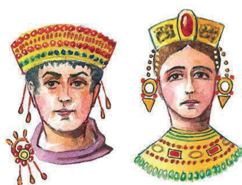
İLL 3. Bizans üslubu