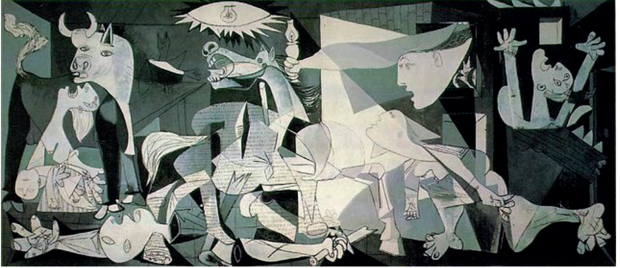
İLL 2.Pablo Pikasso "Gernika"

"Vasili Kandinski:abstrakt sənətdə axtarışlar" mövzusunda şagirdlər abstraksionizm cərəyanının görkəmli rəssamının yaradıcılığı ilə tanış olurlar. Kompozisiya-abstrakt rəngkarlığın ali və ardıcıl formasıdır. Burada gerçəklə birbaşa heç bir əlaqə yoxdur, onların yaradılmasında şüur iştirak edir. Vasili Kandinski üçün kompozisiya bir anlayış olaraq istənilən yaradıcı fəaliyyətin təməlidir. Rəng parçaları və xətlər hərəkət qüvvəsinin cəlbədicisi ruhunu yaradır. Rəssamın ən maraqlı əsərlərindən olan "Kazaklar" tablosu təhlil edilərək, təpələrin görüntüsü, üfüq xətti, at çapan kazakların silüetləri tablonun ümumi dinamikası, ayrı-ayrı forma, xətt və rəng parçaları ilə vəhdət təşkil etməsindən bəhs edilir."Bilirsinizmi" bölməsində Kandinskinin Azərbaycan Milli İncəsənət Muzeyində şüşə üzərində təsvir edilən "Amazonka" əsəri haqqında məlumat verilir.