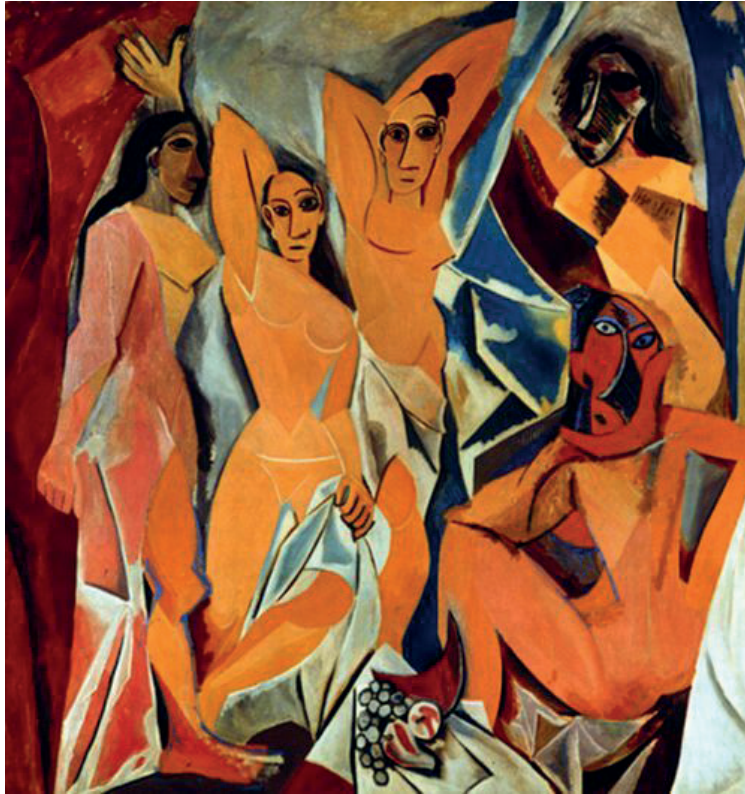
İLL 1.Pablo Pikasso “Avinyon qızları”