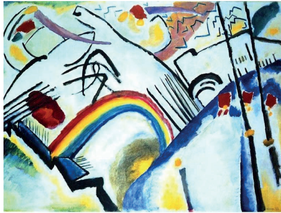
İLL 3.Vasili Kandinski "Kazaklar"

"Vasili Kandinski:abstrakt sənətdə axtarışlar" mövzusunda şagirdlər abstraksionizm cərəyanının görkəmli rəssamının yaradıcılığı ilə tanış olurlar. Kompozisiya-abstrakt rəngkarlığın ali və ardıcıl formasıdır. Burada gerçəklə birbaşa heç bir əlaqə yoxdur, onların yaradılmasında şüur iştirak edir. Vasili Kandinski üçün kompozisiya bir anlayış olaraq istənilən yaradıcı fəaliyyətin təməlidir. Rəng parçaları və xətlər hərəkət qüvvəsinin cəlbədicisi ruhunu yaradır. Rəssamın ən maraqlı əsərlərindən olan "Kazaklar" tablosu təhlil edilərək, təpələrin görüntüsü, üfüq xətti, at çapan kazakların silüetləri tablonun ümumi dinamikası, ayrı-ayrı forma, xətt və rəng parçaları ilə vəhdət təşkil etməsindən bəhs edilir."Bilirsinizmi" bölməsində Kandinskinin Azərbaycan Milli İncəsənət Muzeyində şüşə üzərində təsvir edilən "Amazonka" əsəri haqqında məlumat verilir.