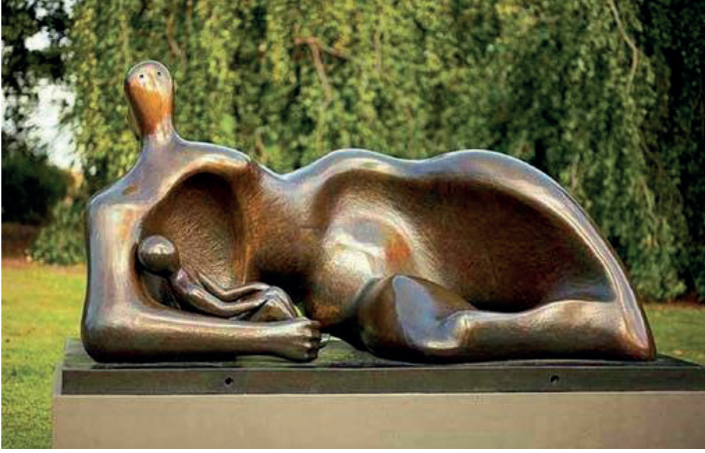
İLL 4. Henri Mur "Ana körpəsi ilə"

“Pol Kli:rəngkarlıqda xətlərin hərəkəti” mövzusunda şagirdlərə Avropa avanqardının görkəmli rəssamının yaradıcılığı təhlil edilir. Kli taxta və iplərdən kompozisiyalar yaradır, onların üzərində fırça ilə işləyirdi, hətta oyunaqlarda düzəldirdi. O, qravürlərə maraq göstərirdi və şüşə üzərində iynə ilə təsviretmənin orijinal texnikasının icad etmişdi.