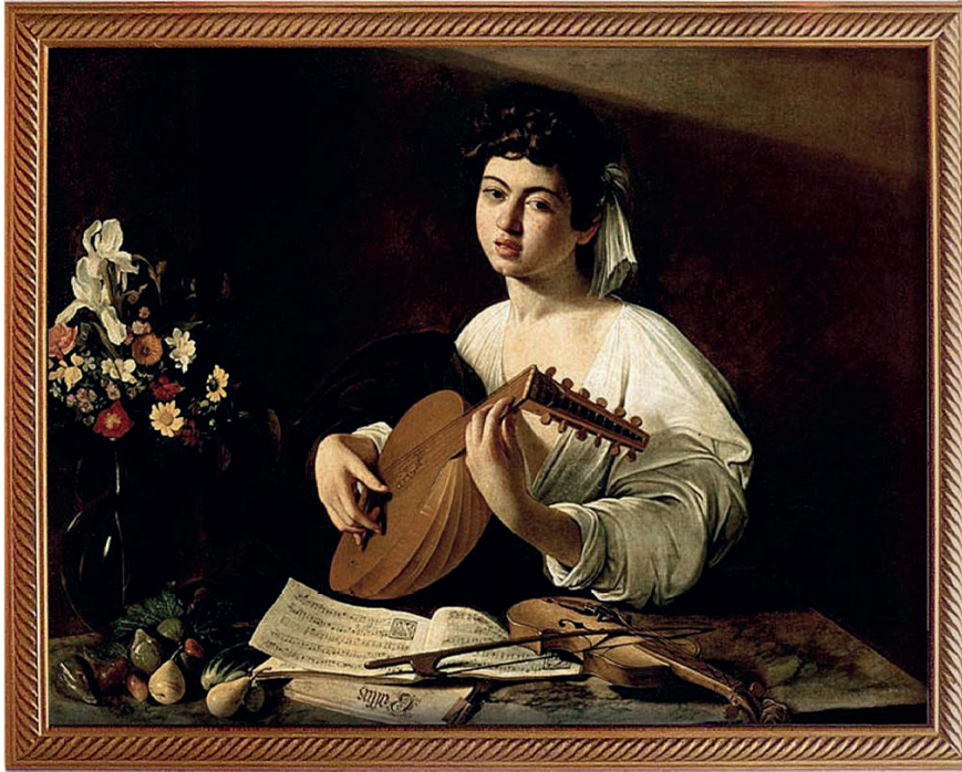
İLL 3. Karavaco "Ud çalan gənc oğlan"

VII sinif təsviri sənət dərslərində özünün çoxsaylı portret təsvirlərini yaratmış Rembrandt yaradıcılığı şagirdlərə təqdim edilir. Rembrandt holland rəngkarlığının qızıl dövründə yaşayıb-yaratmış görkəmli rəssam, qravürçü və işıq-kölgənin mahir ustası kimi tanınmışdır. Rəssamın "Gecə gözetçiləri", "Səfil oğulun qayıtməsi", "Yaşlı qadın portreti", "Həkim Nikolas Tülpün anatomiya dərsi" əsərləri, yaradıcılığının mövzu, üslub, texnikaları cədvəldə yerləşdirilmişdir.