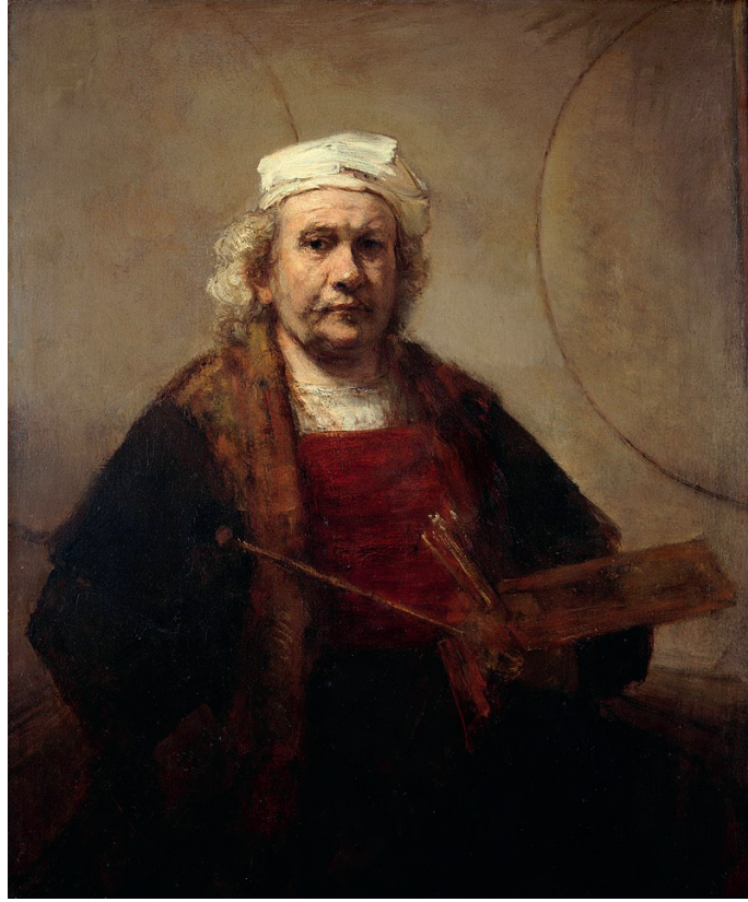
İLL 4. Rembrandt "Avtoportret"

"Süjetli əsərlərdə insan obrazı" mövzusunda görkəmli rus rəssamı İlya Repinin yaradıcılığında insan münasibətləri, əmək fəaliyyəti, gerçək və həyati xarakterlər realist sənətin ən yüksək zirvəsində təsvir edilmiş əsərlər təqdim edilir. Xüsusilə dərslikdə istedadını üzə çıxaran "Burlaklar Volqada" ilk əsəri haqqında məlumat verilmişdir. Bu əsər xalqın qul əməyinə qarşı mərhəmət hissi oyatmaqla yanaşı, onun gücünə, əsarətə qarşı mübarizliyinə inam hissi oyadır.