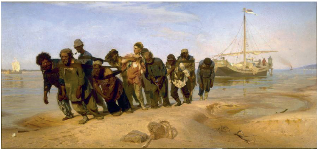
İLL 5. İlya Repin "Burlaklar Volqada"

"Süjetli əsərlərdə insan obrazı" mövzusunda görkəmli rus rəssamı İlya Repinin yaradıcılığında insan münasibətləri, əmək fəaliyyəti, gerçək və həyati xarakterlər realist sənətin ən yüksək zirvəsində təsvir edilmiş əsərlər təqdim edilir. Xüsusilə dərslikdə istedadını üzə çıxaran "Burlaklar Volqada" ilk əsəri haqqında məlumat verilmişdir. Bu əsər xalqın qul əməyinə qarşı mərhəmət hissi oyatmaqla yanaşı, onun gücünə, əsarətə qarşı mübarizliyinə inam hissi oyadır.