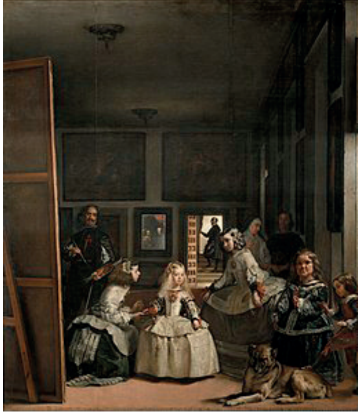
İLL 6. Velaskes “Menina”

Şagirdlər “Rəssam əsərlərində zadəgan geyimləri” mövzusunda Dieqo Velaskesin portretçi rəssam kimi formalaşması, əsərlərində kral yaxınlarının təntənəli portretlərində geyimlərin və hərəkətlərin təmkinli gözəlliyi, interyerlərin əzəməti şagirdlərdə estetik reaksiyanı inkişaf etdirir. Dieqo Velaskesin ən məşhur əsərlərindən biri “Menina” dərsləkdə xüsusilə vurğulanır. Əsərdə ön planda – balaca sarışın infanta Marqarita saray xanımları və cırdan adamların əhatəsində təsvir olunmuşdur. Onların yaxınlığında isə rəssam çox böyük məharətlə öz portretini təsvir etmişdir. Uşaqılıqdan şahzadəyə xidmət edən gənc saray xanımları “menina” adlandırıldığı üçün əsər də eynən bu cür adlandırılmışdır.