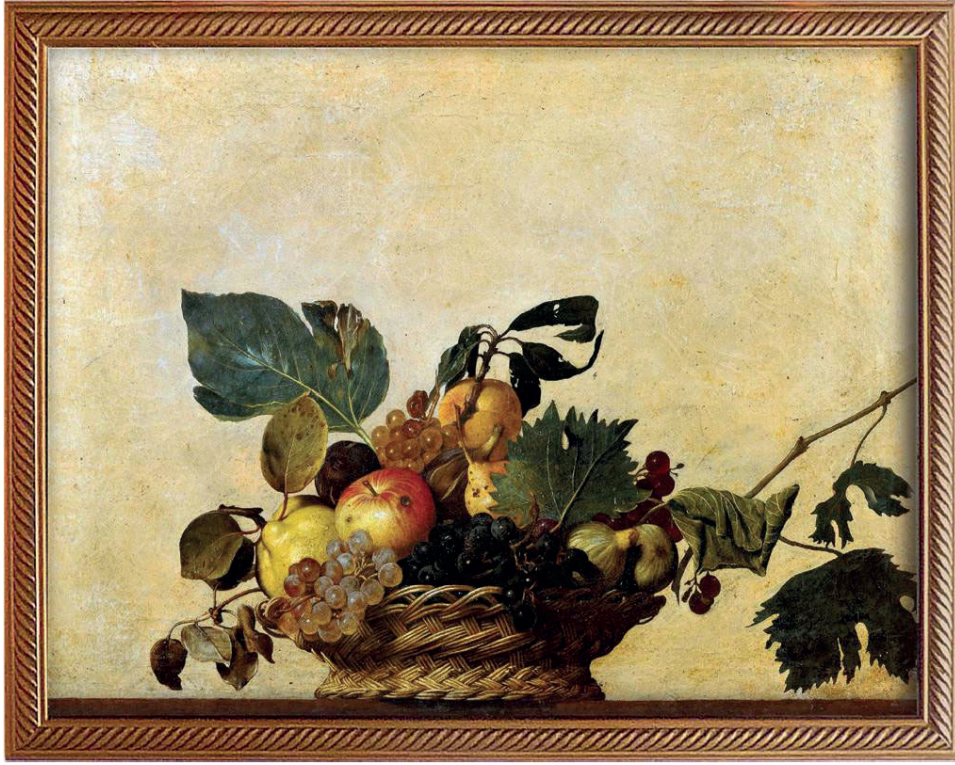
İLL 2.Karavaco "Səbətə meyvələr"