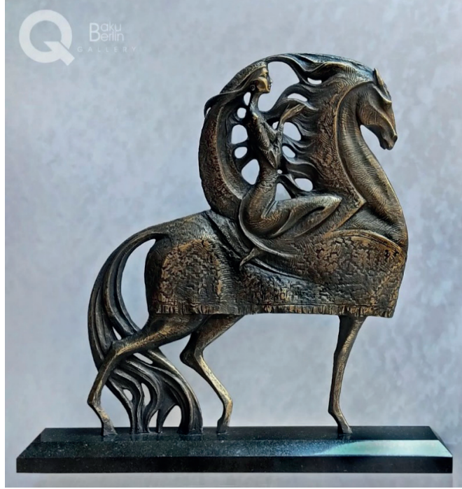
İLL 5. Kamran Əsədov “Qarabağ gözəlləri” (2022) (bürünc, 73,5x75x12 sm)