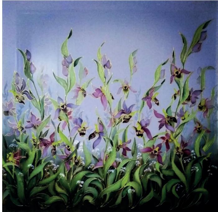
İLL 4. Əfşan Əsədova "Xarıbülül" (kətan, yağlı boya)

Əfşan Əsədova "Xarıbülül" əsərində şəhadət və məhəbbət rəmzinə bütün diqqəti cəlb etmişdir. Azad Qarabağda çiçək açan xarıbülül igid Azərbaycan qəhrəmanlarının ayaq səsinə oyanaraq onları salamlamışdır.