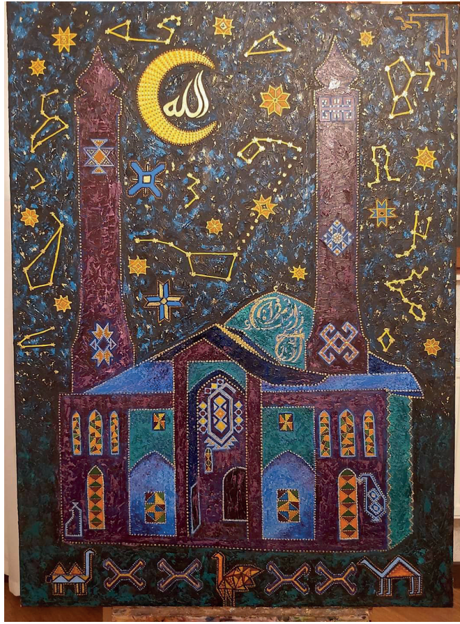
İLL 1. Aynur Rzayeva “Şuşa.Yuxarı Gövhərağa məscidi” (kətan, yağlı boya)

Aynur Rzayeva “Şuşa.Yuxarı Gövhərağa məscidi” əsərində Qarabağ xalça elementlərinin rəngarəngliyini təqdim etmişdi. Tarixi memarlıq abidəmizin təqdimatı dekorativdir. Səmada isə Allah yazısı xalqımızın duaları nəticəsində Şuşanın azadlığa çıxmasıdır.