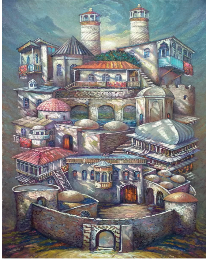
İLL 3. Fuad Manafov "Qarabağname" (kətan, yağlı boya, 75x35 sm)

Əfşan Əsədova "Xarıbülül" əsərində şəhadət və məhəbbət rəmzinə bütün diqqəti cəlb etmişdir. Azad Qarabağda çiçək açan xarıbülül igid Azərbaycan qəhrəmanlarının ayaq səsinə oyanaraq onları salamlamışdır.