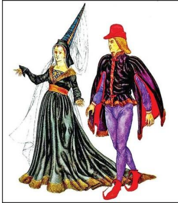
Fig 5. Gothic clothing

both in architecture and in clothing. The clothing of the Renaissance attracts attention with the presence of symmetry and the lack of decoration on it. These clothes were made of expensive and intricately ornamented fabrics, and the sleeves were cut in an unusual shape. Formality, heavy clothing, serious appearance, luxury and unusualness are more typical for Baroque style. In the Rococo period, the preference for the use of numerous frills and satin, various accessories made the clothes of this period more luxurious. The individual characteristics of the clothes belonging to each of these styles are analyzed in the textbook.