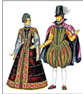
Fig 6. Renaissance clothing

In the textbook on "Azerbaijani headwear", students first of all learn that the hat is considered a symbol of courage, honor and dignity for men, regardless of their position in society. In the past, the position and social status of the wearer could be determined by the shape of the hat. It was considered impolite to go to public places without a headdress. Men's hats are mainly made of sheepskin with long and soft hair, or karagul (lambskin), which is presented in the images in the illustrations. Also, information about aragchin, shawl and kalaghayi was given in the topic.