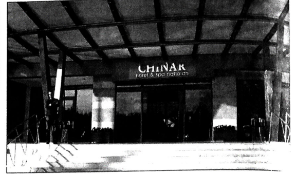
Chinar Hotel & Spa Naftalan kompleksinin baş həkimi Çingiz Hacıyev kompleksin hotel bölməsi haqqında da infotur iştirakçılarının geniş məlumat verdi. O, bildirdi ki, hotelde 1 Royal suite, 6 Deluxe rooms, 4 Suites, 100 Superior rooms, 59 Standard rooms olmaqla 170 yaşayış otağı var. Otaqlarda 81 ekran LCD TV, mini bar, seyf, WIFI internet, telefon və s. mövcuddur. Kompleksdə İsveç masaj sistemi ilə çalışan "Sapfir" restoranı, "Lobby" kafe-bar, "Vitamin" bar və "Paradis" bar fəaliyyət göstərir. Həmçinin toplantıların keçirilməsi üçün "Sədəf" və "Berif" iclas zalı qonaqların ixtiyarına verilir.

kurortların 2009-2018-ci illərdə inkişafı üzrə Dövlət Programı" və "Azərbaycan Respublikasında 2010-2014-cü illərdə turizmin inkişafına dair Dövlət Programı" qəbul olunmuşdur. Programlar üzrə nəzərdə tutulmuş işlər həyata keçirildikdə regionların daşınması dəyişir. Turizmin inkişaf etməsinin