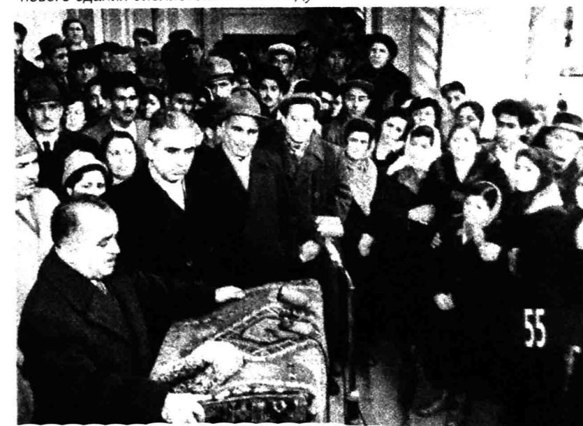
Народный писатель Сулейман Рагимов и академик Юсиф Мамедалиев на открытии нового здания библиотеки в 1961 году

Но научно-технический прогресс не останавливается, и библиотечное дело также не стоит на месте. 21 апреля 2007 года вышло распоряжение президента республики «Об улучшении деятельности библиотек в Азербайджане», в котором содержится отдельное указание о плане мероприятий по модернизации