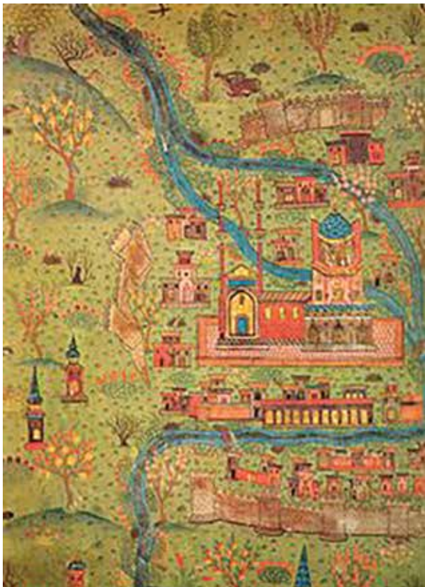
Тебриз на миниатюре XVII века