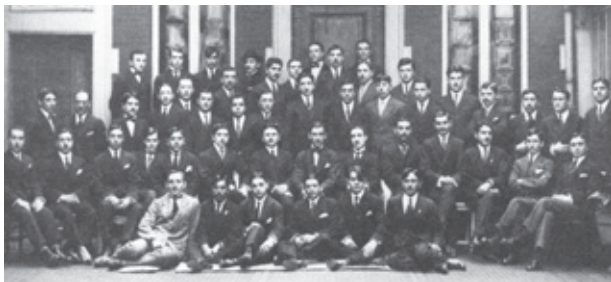
Группа азербайджанских студентов, отправляющихся на учебу в Европу за государственный счет. 1920 год

карта страны. Однако уже с самого начала азербайджанское государство столкнулось с необоснованными претензиями на Карабах и ряд других земель со стороны Армянской Республики, которая была провозглашена одновременно с АДР. На переговорах с министром иностранных дел Османской империи в Стамбуле 18 ноября 1918 года председатель парламента Азербайджана Алимардан-бек Топчубашов сказал: «Карабахский вопрос, поднятый армянами, касается не 5 или 10 деревень, он охватывает все четыре уезда: Шушу, Джаваншир, Джебраил и Зангезур. Эта территория принадлежит только одной нации, и хотя количество мусульман и армян не равно, нет оснований говорить о господстве армян, потому что они не являются коренными жителями этих мест. Это те, кто переехал в наш регион из Турции после войны с Россией... Наконец, армяне не живут в самом Карабахе отдельно, они образуют смешанные поселения с азербайджанцами. Тем не менее, мы выступаем за мирное урегулирование проблемы».