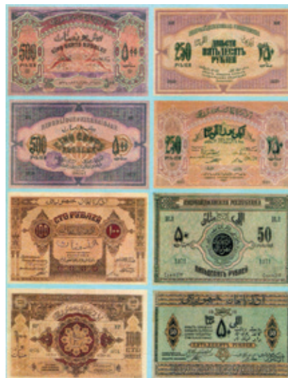
Купюры денежной единицы АДР – маната разного номинала. Национальный музей истории Азербайджана

сказать, что современный сильный Азербайджан - достойный преемник АДР. 🌟