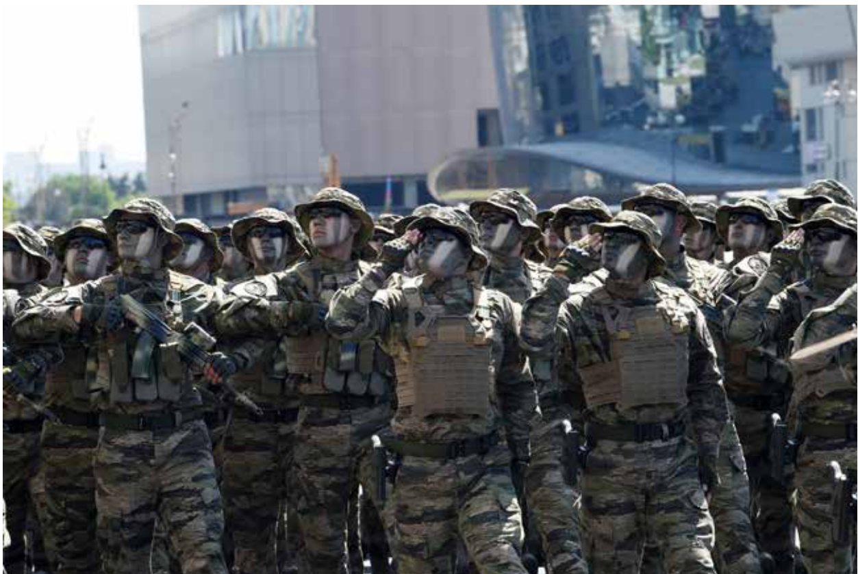
22 мая 1998 года президент Азербайджана Гейдар Алиев подписал распоряжение, которым дата