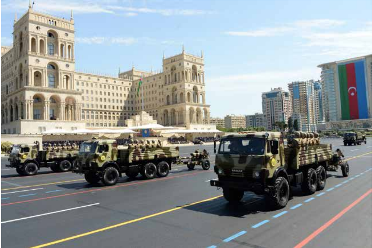
успешного контрнаступления зимой 1994 года в Физулинском районе.