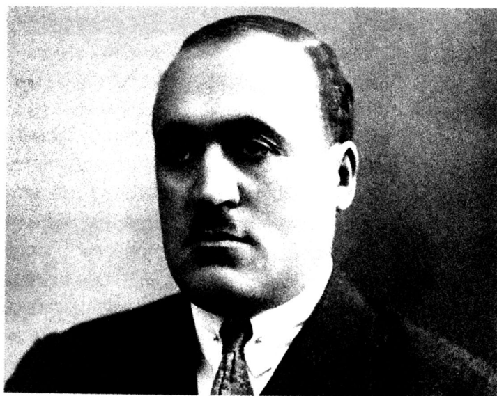
Мамед Саид Ордубади