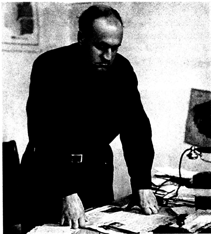
Мамед Саид Ордубади за рабочим столом

За революционную деятельность в январе 1914 года Мамед Саид был выслан в город Царицын Самарской губернии. После победы Октябрьской революции переехал в Астрахань, работал в газете «Гуммет» («Старательный») азербайджанских социалистов – вначале сотрудником, а затем редактором. В мае 1920 года, т.е. после советизации Ордубади переехал на постоянное жительство в Баку , где стал активно печатать стихи, статьи и