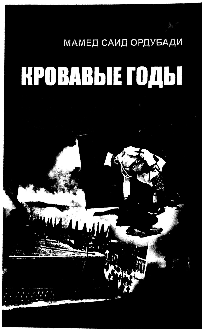
Обложка одной из книг писателя

Низами достал из-за пазухи толстое, похожее на тетрадь, письмо.