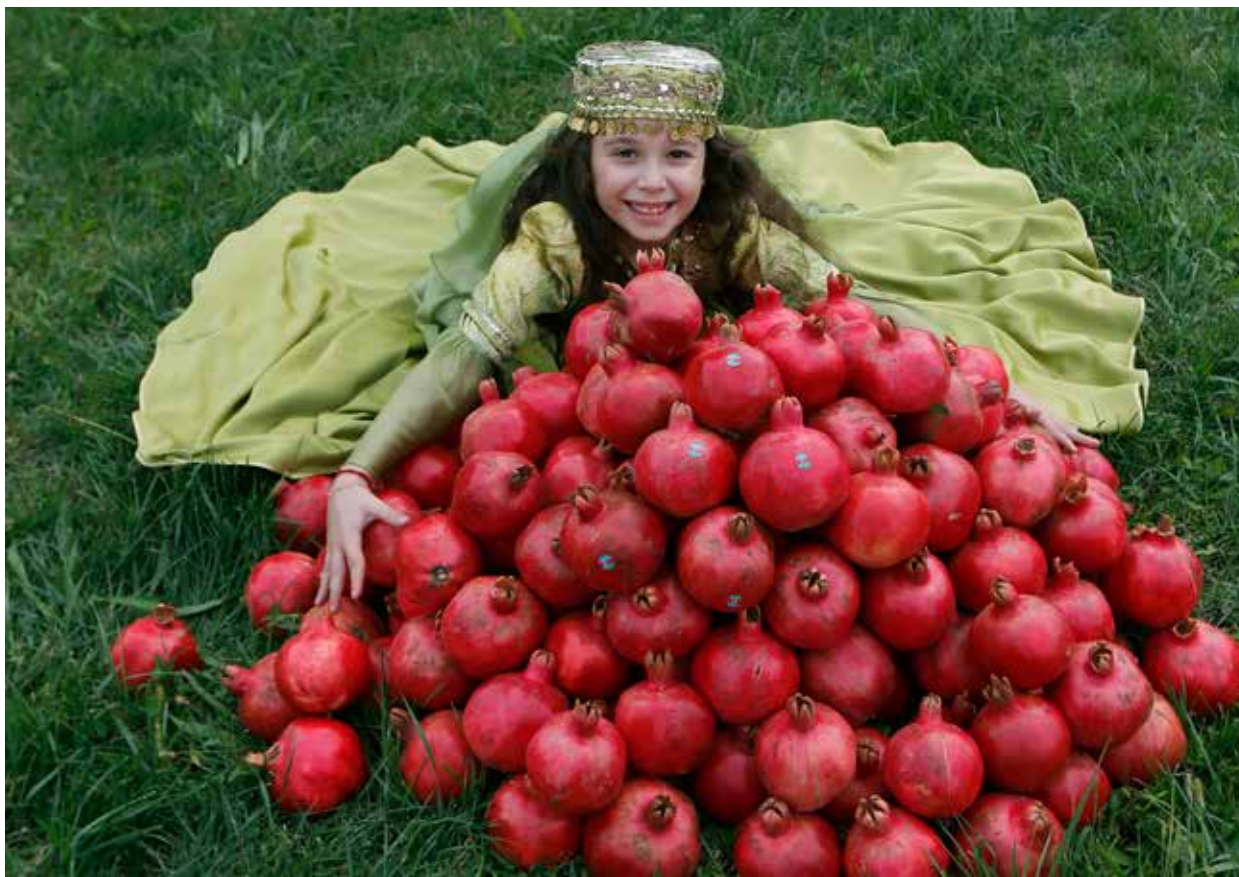
стоянках Гырлатепе и Галагах (Исмаиллинский район) обнаружено большое количество остатков обгоревших семян винограда. При раскопках в древнем городище Габалы найдены остатки