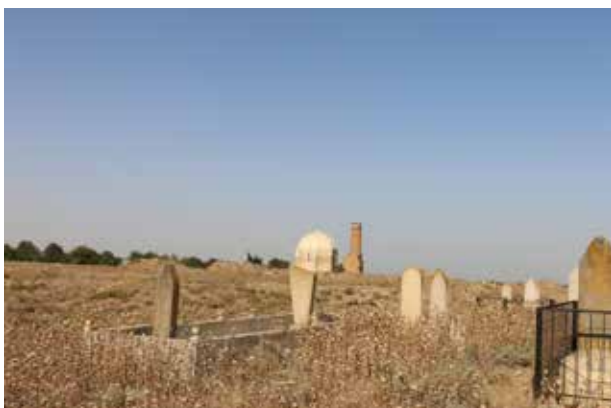
Средневековое кладбище в селе Бабы

три облицованы керамическими изразцами двух цветов - синего и бирюзового. В-третьих, в склепе мавзолея имеется мехраб – случай, который можно назвать уникальным. Исключением является мавзолей в виде подземного склепа вблизи сел. Шарафан, остатки которого в 40-х годах XX столетия изучал И.П.Щеблыкин. Он писал, что в торцевой лопасти крестового склепа устроен мехраб в виде неглубокой четырехугольной ниши. В четвертых, на территории Азербайджана неизвестны другие склепы, в которых места захоронений устроены отдельно, вне зала склепа, в данном случае в комнатках с небольшими могилами.