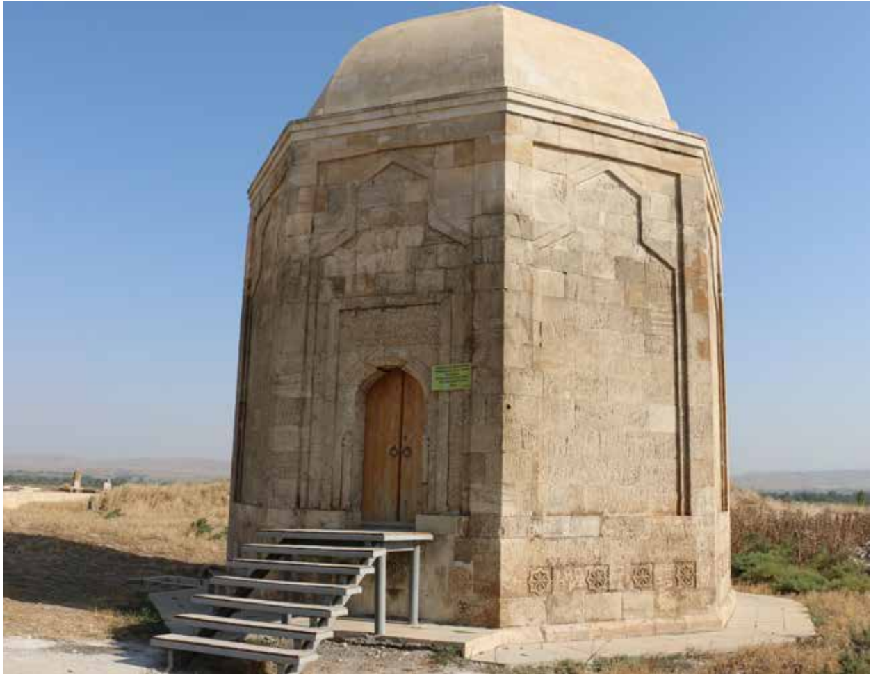
Общий вид мавзолея Шейх Бабы Йагуба

нефа, где сохранились следы портала. На южной стене этого зала, напротив входа, находится мехраб полукруглого сечения, радиусом 31 см. Мехраб сложен из кирпича и немного заглублен от линии стен, облицованных когда-то хорошо обработанным известковым камнем. Пилоны, примыкающие к южной стене, и Г-образная конфигурация колонн образуют перед мехрабом квадратное пространство, когда-то перекрытое, видимо, куполом или крестовым сводом. Второй зал размерами 14.60x8.85 м поделен каменными пилястрами и примыкает к первому залу. На северной стене зала сохранилось полукруглое углубление - бухара, кирпичи которого сильно обгорели. Между первым и вторым залом имеются два дверных проема.