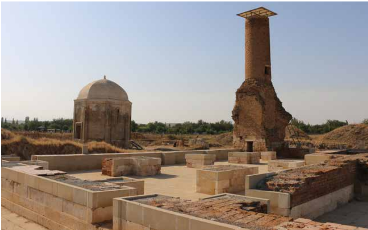
Общий вид комплекса во время археологических работ