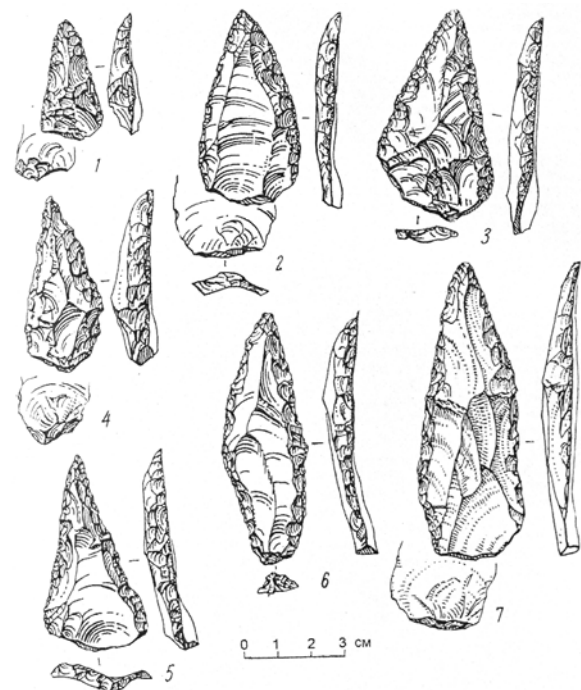
Пещера Таглар. Образцы леваллуазских ретушированных и мустьерских остроконечников. По М.Гусейнову

стоянке было найдено несколько микролитических орудия, аналоги которых зафиксированы на стоянках Гая-Арасы и Фируз в Гобустане . Что касается верхне-палеолитических орудий труда, найденных при раскопках третьего культурного слоя, то аналоги их были выявлены и изучены во втором культурном слое многослойной палеолитической стоянки на берегу р. Куручай . Материалы, найденные на Шущинской палеолитической стоянке в ходе археологической разведки летних полевых работ 1971-1973 гг., наглядно свидетельствуют о расселении первобытного человека на данной территории. Следует отметить, что полная стратиграфия культурных слоев на этой стоянке не конкретизирована – этот вопрос будет решен в ходе будущих археологических исследований. В конце 80-х годов было запланировано продолжить работу в этом направлении, но начало трагических событий в Карабахе и вокруг него, последовавшая военная оккупация края Арменией нарушили эти планы. С этого времени армянская сторона проводит в Карабахе – на оккупированной территории Азербайджана археологические раскопки в нарушение действующих норм международ-