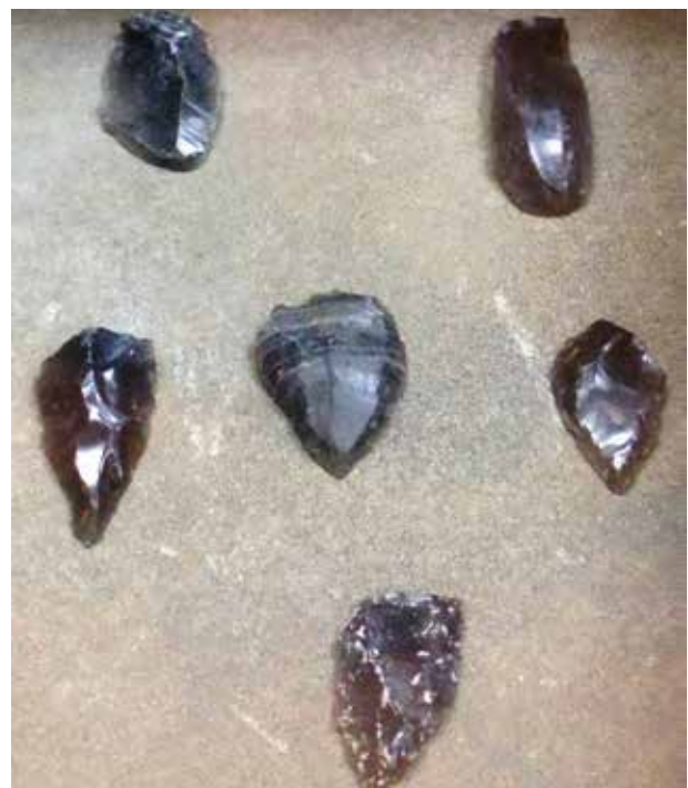
Орудия труда из обсидиана и кремния из памятников Таглар и Зар. Национальный музей истории Азербайджана

Примечательно, что при раскопках второго культурного слоя на Шушинской палеолитической