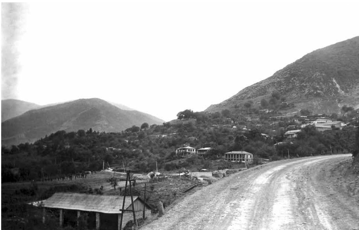
Карабах. Общий вид селения Туг . 1970-е годы

В 60-70-е годы прошлого века азербайджанскими учеными во главе с М.Гусейновым в ходе археологических исследований долин рек Куручай и Конделен-чай в Карабахе были открыты и введены в научный оборот уникальные многослойные палеолитические стоянки Азых и Таглар . В ходе дальнейших раскопок на этих стоянках, расположенных в карстовых пещерах, найден богатейший материал, относящийся к различным археологическим периодам и культурам. Среди них орудия труда и кости убитых на охоте диких животных, относящиеся к куручайской культуре ,