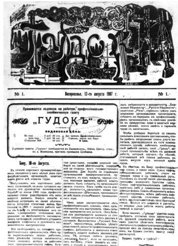
Номер газеты "Гудок" со статьей об армяно-азербайджанских столкновениях в Баку

Тем временем азербайджанцы стали принимать меры самозащиты, также начали поджигать дома противной стороны. 17 августа азербайджанцы