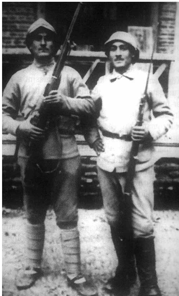
Пехотинцы азербайджанской армии

К концу октября армянские радикалы начали активно наращивать свои вооруженные силы в