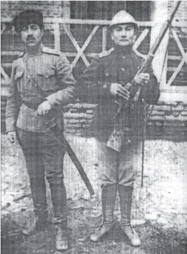
Кавалеристы азербайджанской армии

Карабахе и одновременно при прямой поддержке своих покровителей – правительств стран Антанты раскручивали на международной арене яростную кампанию против Османской империи. Утверждалось в частности, что турецкие войска из Карабаха введены непосредственно на территорию Армении, что турецкие военные, мол, в Карабахе убивают мирных армян и т.п. Вдобавок глава нового османского правительственного кабинета Ахмет Иззет-паша, не имея достаточной информации о положении дел на Кавказе, поддавался давлению со стороны зарубежных государств и 23 октября дал указание о выводе османских воинских частей из Карабаха (16). Спустя неделю, 30-го числа был подписан Мудросский мирный договор, оформивший поражение османской империи в первой мировой войне и в числе прочего оговоривший вывод турецких войск с территории Азербайджана. Естественно, что уход приданных турецких подразделений не мог не ослабить дислоцированную в Карабахе 1-ю азербайджанскую дивизию, новым командиром которой был назначен генерал-майор Ибрагим-ага Усубов (17).