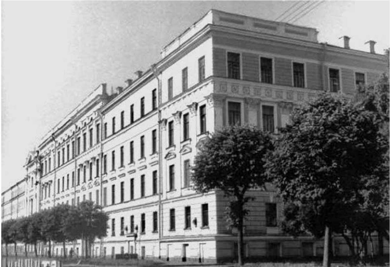
Санкт-Петербургское военно-топографическое училище в начале XX века