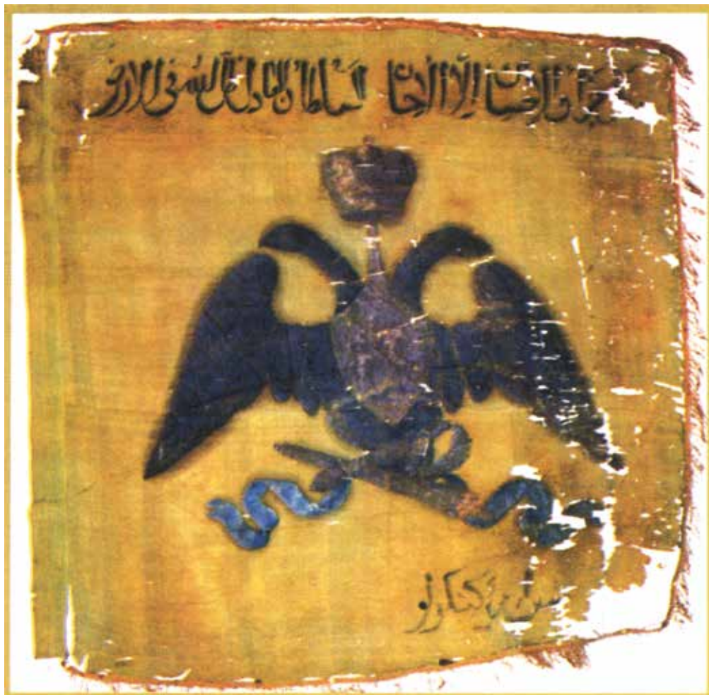
Почетное знамя конницы Кенгерли. Национальный музей истории Азербайджана. Фонд оружия и знамен (НМИА ФОЗ)

В военной истории Азербайджана особое место занимают иррегулярные части, которые формировались в XIX столетии после захвата региона Россией из азербайджанцев, или, как их называли в