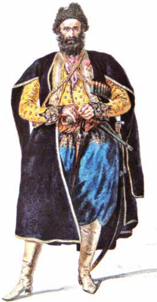
Закавказский мусульманин (азербайджанец). Неизвестный художник

храбростью и постоянным мужеством служившим в войне с Турцией», пожаловал им особые знамена с изображением российского герба и с сохранением в гербе изображения Св. Георгия; на древках же знамен вместо креста было помещено вензелевое имя императора. При этом почетное знамя 1-го конно-мусульманского полка было предписано хранить в г. Шуше «как знак Монаршего Нашего внимания к верности и заслугам жителей Карабахской провинции и Пессиянских куртин, составлявших 1-й Мусульманский полк»; почетное знамя 2-го конно-мусульманского полка было предписано хранить в г. Шамахе «как знак Монаршего Нашего внимания к верности и заслугам жителей Ширванской и Шекинской провинций, составлявших 2-й Мусульманский полк»; почетное знамя 3-го конно-мусульманского полка