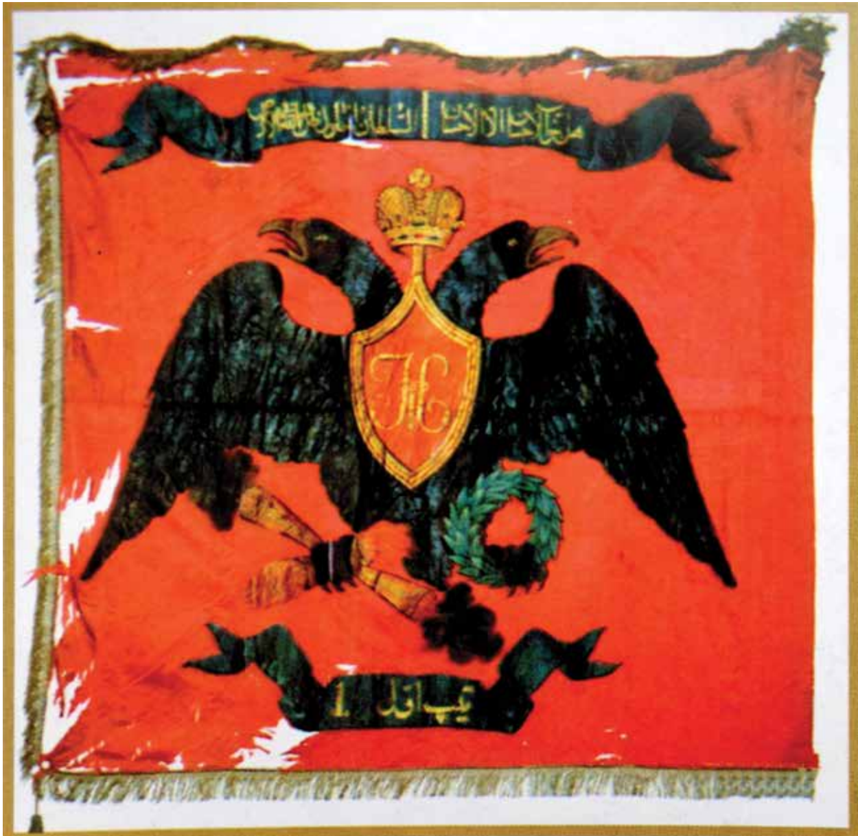
Почетное знамя 1-го конно-мусульманского полка.

манский полк из жителей Карабахской провинции; 2-й – из жителей Шекинской и Ширванской провинций (бывшие одноименные ханства); 3-й – из жителей Елисаветпольского округа (бывшее Гянджинское ханство) и «татарских» дистанций: Борчалинской, Казахской и Шамшадильской (бывшие одноименные султанства); 4-й – из жителей так называемой Армянской области (бывшие Эриванское и Нахчыванское ханства); 250 бойцов конницы Кенгерлы набирались из жителей бывшего Нахчыванского ханства (4, с. 18). Командирами конных мусульманских полков назначались русские штабс- и обер-офицеры, а помощниками к ним - «беки из самых лучших и богатейших фамилий, имеющие