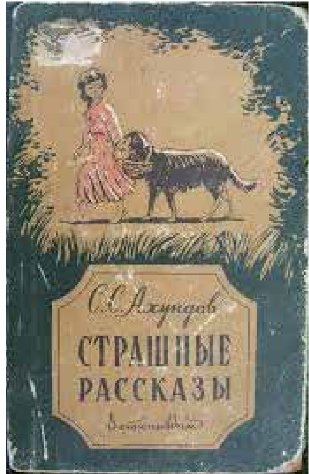
Лицевые обложки книг С.С.Ахундова

первый. Баку, «Детюниздат», 1961. 474 с.