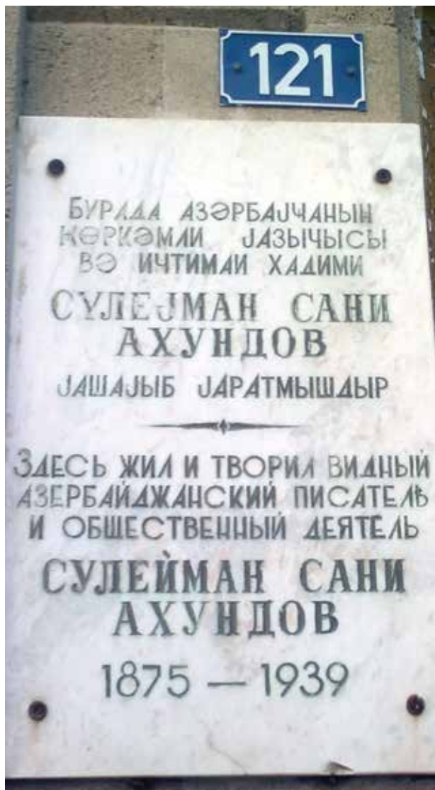
Памятная доска на доме в Баку, где жил С.С.Ахундов

Сулейман Сани Ахундов в расцвете физических и творческих сил скоропостижно скончался от сердечной болезни 29 марта 1939 года. Прах его покоится на Аллее почётного захоронения в Баку.