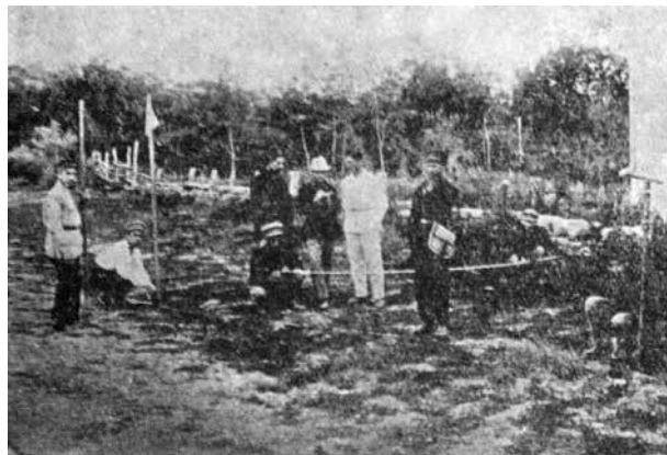
Преподаватели и студенты топографо-геодезического техникума на полевых съемках. 1926 г.