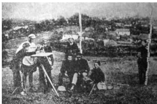
Преподаватели и студенты топографо-геодезического техникума на полевых съемках. 1927 г.