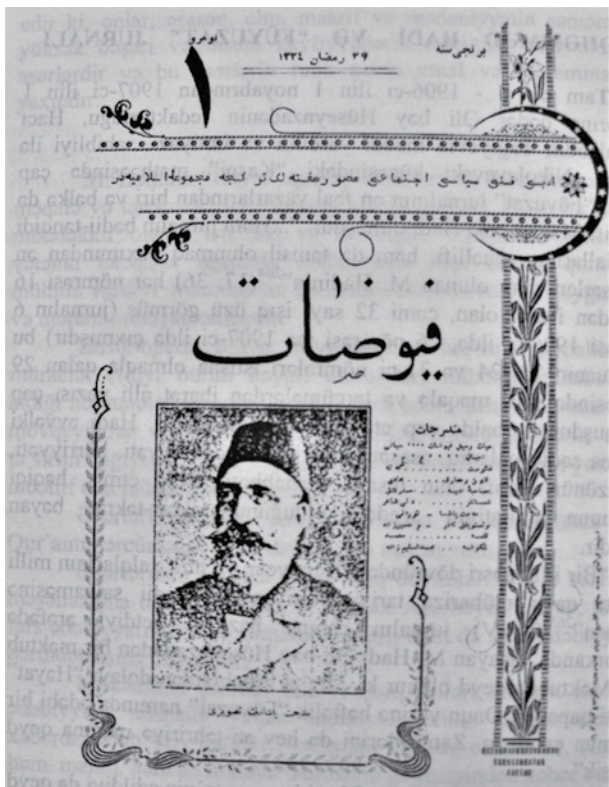
Титульный лист журнала "Фуюзат", в редакции которого работал М.Хади

изведения Низами, Саади, Хайяма, Хафиза и Руми. Творческое наследие выдающихся турецких поэтов Намыка Кемаля (1840–1888) и Тевфика Фикрета (1868–1914) служили для Мухаммеда Хади поистине неиссякаемым источником вдохновения.