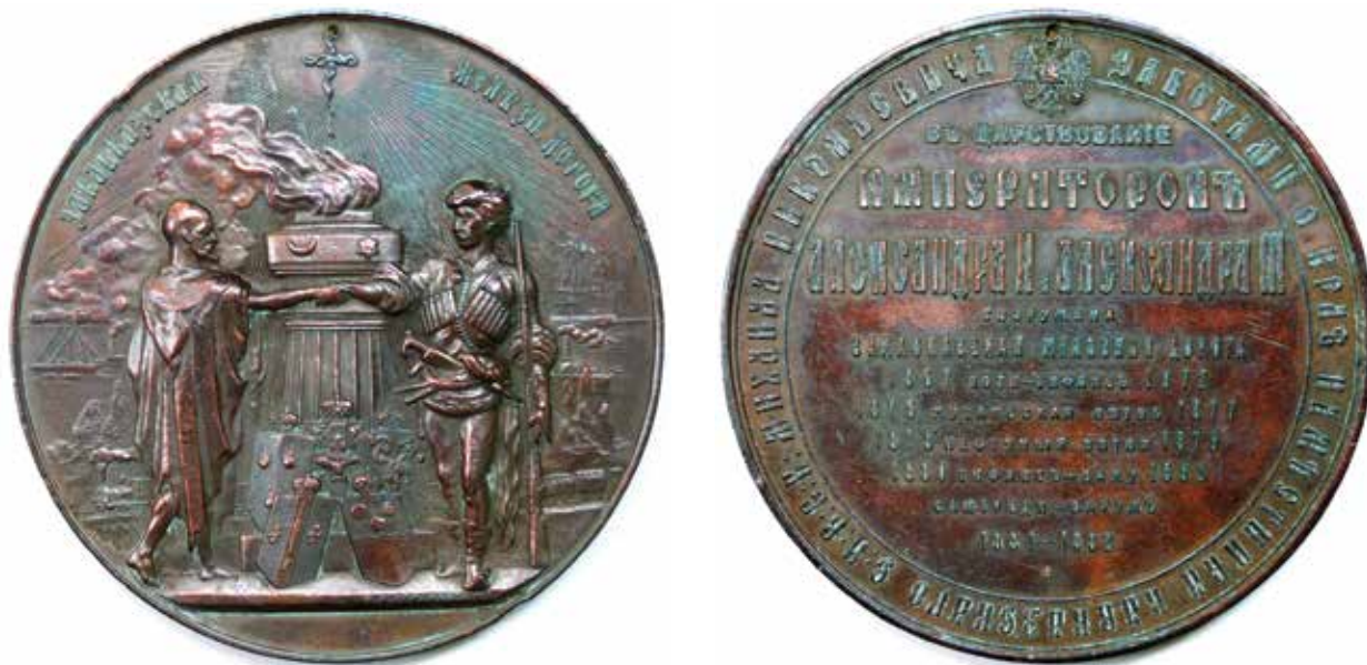
Медаль в честь открытия Закавказской железной дороги. Аверс и реверс. 1883 г. Национальный музей истории Азербайджана. Фотография публикуется впервые