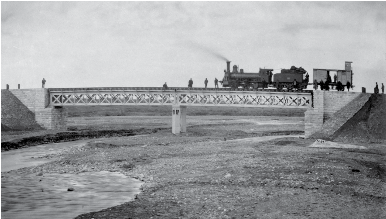
Железнодорожный мост через р. Шамхорчай. 1900 г. Фотография публикуется впервые

В 1906 году был разработан проект железной дороги Баку – Ленкоран , который из-за отсутствия средств не был реализован.