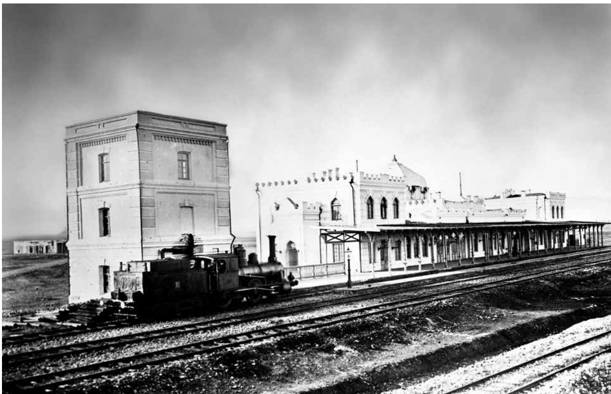
Железнодорожная станция Гаджигабул. 1900 г. Фотография публикуется впервые

Ни правительство, ни проектировщики железной дороги не ожидали таких объемов перевозок нефти и нефтепродуктов. С другой стороны, государство и частный капитал стремились извлечь из железной дороги максимальную прибыль. На