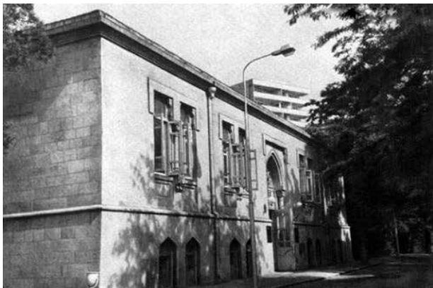
Здание общества "Саадет" в Баку, построенное в 1912 году

классов носили шапки с белыми полосками и серебряной пластинкой посередине. Выпускникам прогимназии позволялось наведываться в родную школу в черном костюме с галстуком.