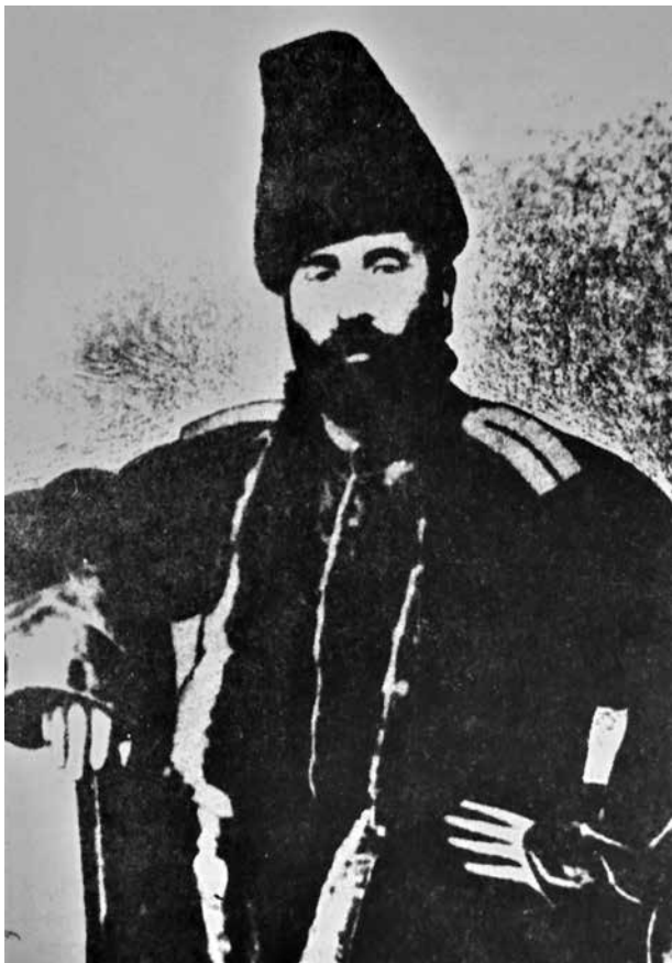
Капитан (впоследствии генерал, кавалер ордена Св.Георгия) Исмаил-хан Нахчыванский

В начале 1840-х гг. была предпринята попытка организовать в завоеванных азербайджанских владениях иррегулярные части наподобие казачьих полков . Одним из инициаторов создания таких частей вновь выступил князь Варшавский граф Паскевич-Эриванский, который, уже будучи наместником в Царстве Польском, писал императору: «Магафы (прим.1), персиянские куртины, кянгерлы и другие кочующие племена за Кавказом могли бы вообще составить нерегулярную конницу, в роде наших Донских казаков, и были бы очень полезны нам на этом основании. Но наперед надобно собрать об них верные сведения и сделать расписание на полки, которые будут выходить на службу с собственным оружием и лошадьми без всякого пособия от правительства, исключая жалованья, провианта и фуража, за время действительного служения, когда же мера эта утвердится, то ее можно будет постепенно распространить и на прочих поселян» .