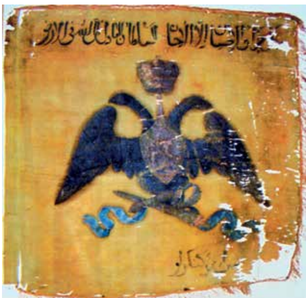
Знамя конницы Кенгерли. Национальный музей истории Азербайджана (НМИА)

Продолжение. Начало см. IRS–Наследие , 2019, № 1-3 (97-99)