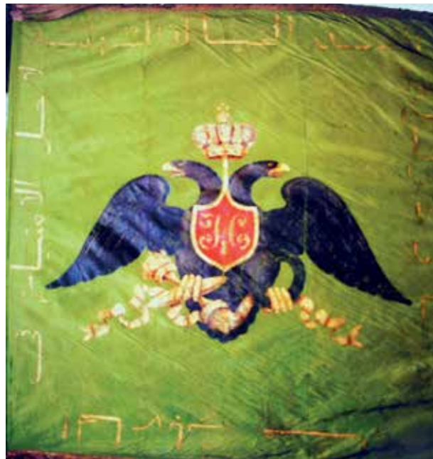
Почетное знамя Ширванской конной милиции.