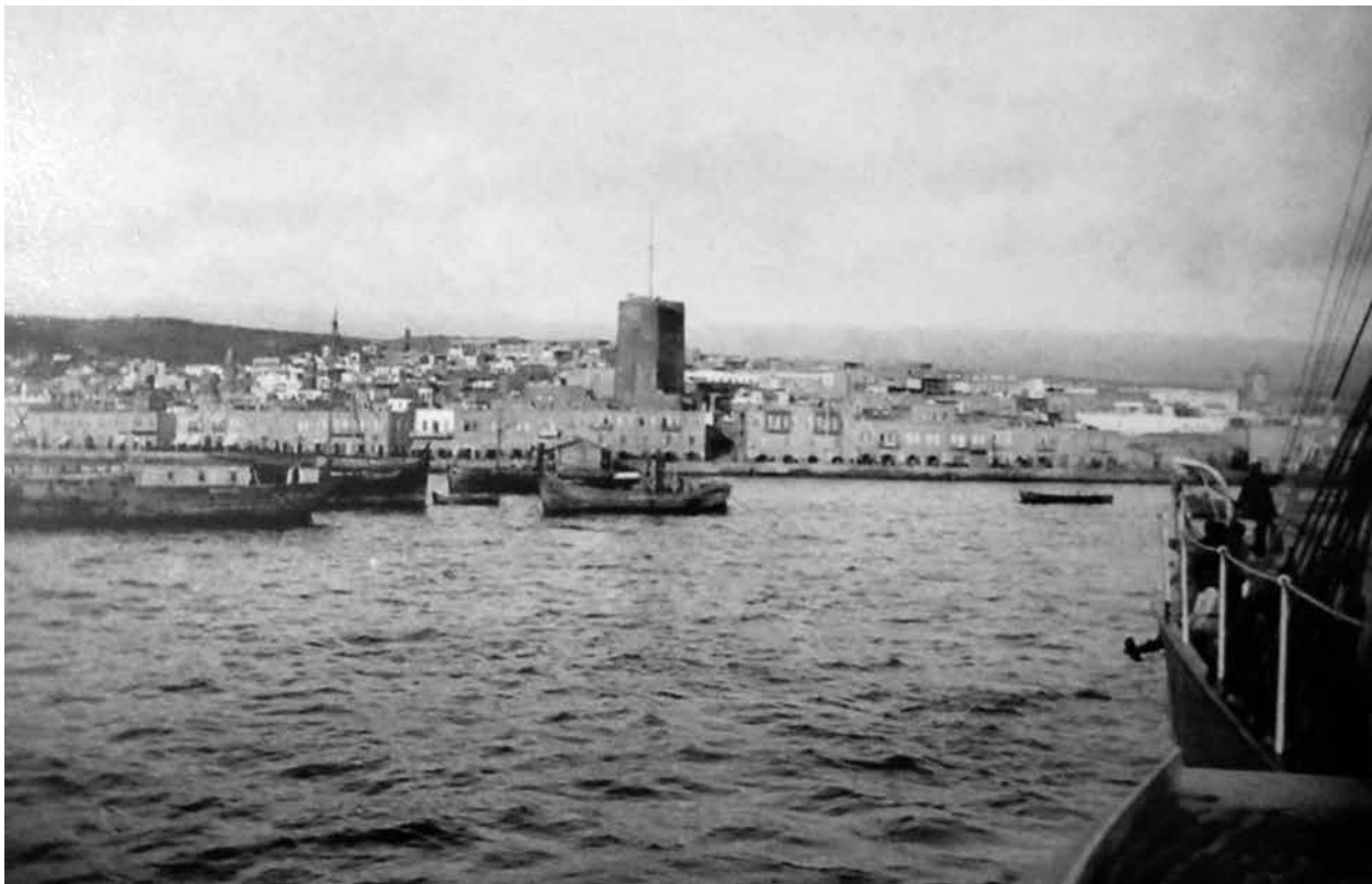
Баку. Вид на прибрежную часть города.

крайних отрогов Кавказского хребта. Где я нахожусь, в Персии или в России?.. Конечно, в России - раз Грузия является русской провинцией, но можно подумать, что и в Персии - настолько Баку сохранил свой персидский колорит [с XVI до начала XVIII