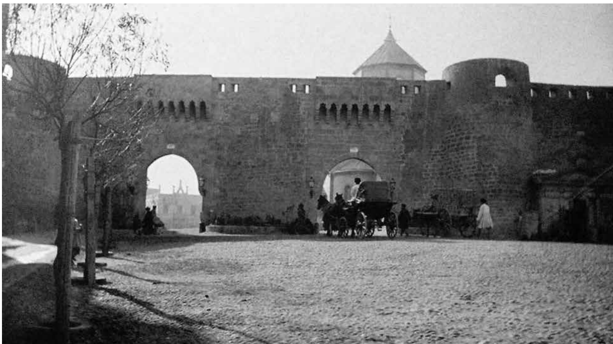
Баку. Думская площадь, Шемахинские ворота и Николаевский собор.

вв. Баку находился под властью персов]. Я осматриваю ханский дворец, архитектурный памятник времен Шахрияра и Шахразады, «дочери луны» и искусной рассказчицы. Тонкая скульптура во дворце так свежа, будто только что вышла из-под резца