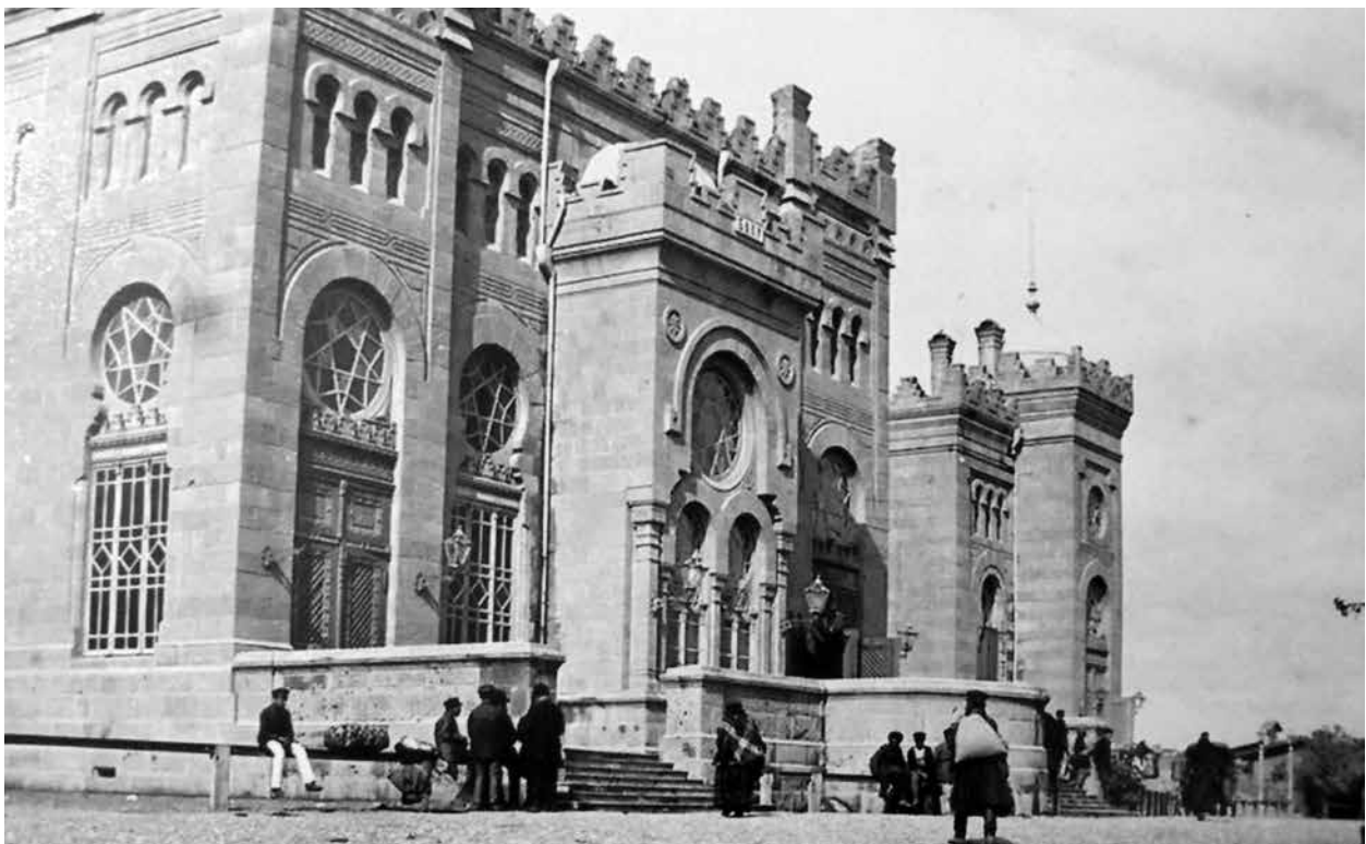
Баку. Железнодорожный вокзал.

The article provides brief information about prominent French photographer of the early 20th century Paul Nadar, and his journey to the East, during which he visited Baku and left a number of interesting photos of the city. The article also contains an excerpt from Jules Verne's novel "Claudius Bombarnac", an artistic description of the journey to Baku.