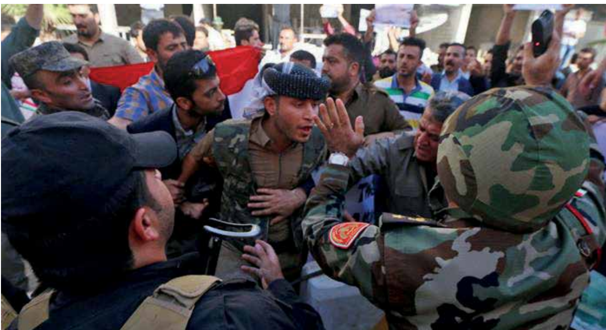
На разгон акции протеста курдов-йезидов правительство Армении бросило военную полицию

После провала попытки заселить оккупированный нагорно-карабахский регион Азербайджана сирийскими армянами армянские власти решили воспользоваться ситуацией с иракскими курдами-йезидами, некоторые регионы компактного расселения которых были захвачены террористами «ИГИЛ». В 2014 году пресс-секретарь «НКР» Давид Бабалян заявил, что представляемый им сепаратистский режим готов предоставить убежище иракским йезидам. Местом их поселения был выбран оккупированный Лачинский район Азербайджана. Это был далеко идущий план: во-первых, Лачинский район имеет важное стратегическое значение, а во-вторых, в случае возобновления войны курды-йезиды без труда могли превра-