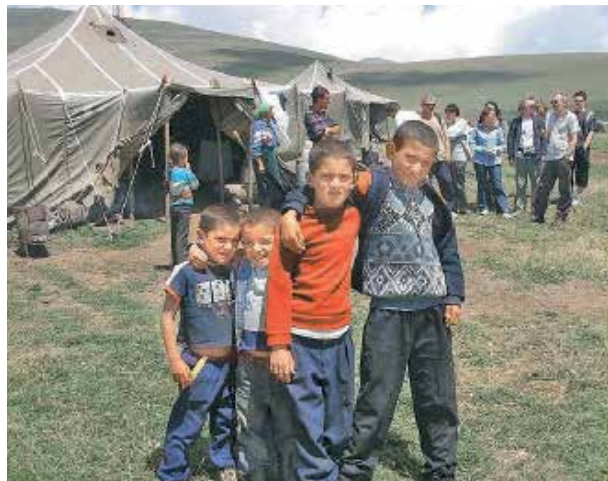
Курды-йезиды Армении, лишённые элементарных бытовых условий

Доклад Консультативного комитета по Рамочной конвенции о защите национальных меньшинств Совета Европы и другие источники показывают, что Армения не соблюдает международные