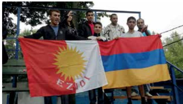
Курды-йезиды Армении требуют автономию

них ни организационных, ни людских ресурсов. В связи с этим Консультативный комитет отмечает, что в течение последних пяти лет законодательная база и политика правительства в отношении поддержки культурной деятельности национальных меньшинств не претерпела изменений.