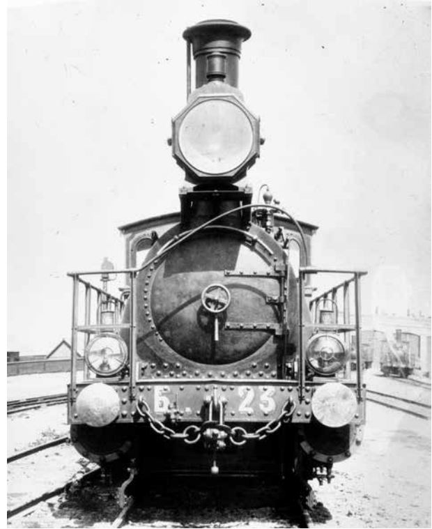
Паровоз на станции Елизаветполь. 1902 год

С учетом изложенного инициаторы строительства Карабахской железной дороги еще более активизировались в начале 1914 года, рассчитывая добиться разрешения на строительство в том же году с тем, чтобы начать строительство в 1915 году и завершить все работы к концу 1918 года. При этом начать временное движение по новой дороге планировалось в конце 1916-го – начале 1917 года (4, с. 5). Согласно подсчетам, постройка Карабахской железной дороги вместе с боковыми ветками и обеспечение ее подвижным составом должны были обойтись в 38 млн. рублей, т.е. в среднем 83 тыс. руб. за версту . Для постройки дороги планировалось создать акционерное общество с правительственными гарантиями на 4,5-процентную доходность акций (4, с. 87, 90). Кроме того, по окончании строительства предполагалось взять готовую линию на концессию сроком в 81 год. Однако начавшаяся первая мировая война перечеркнула все эти планы. ❀