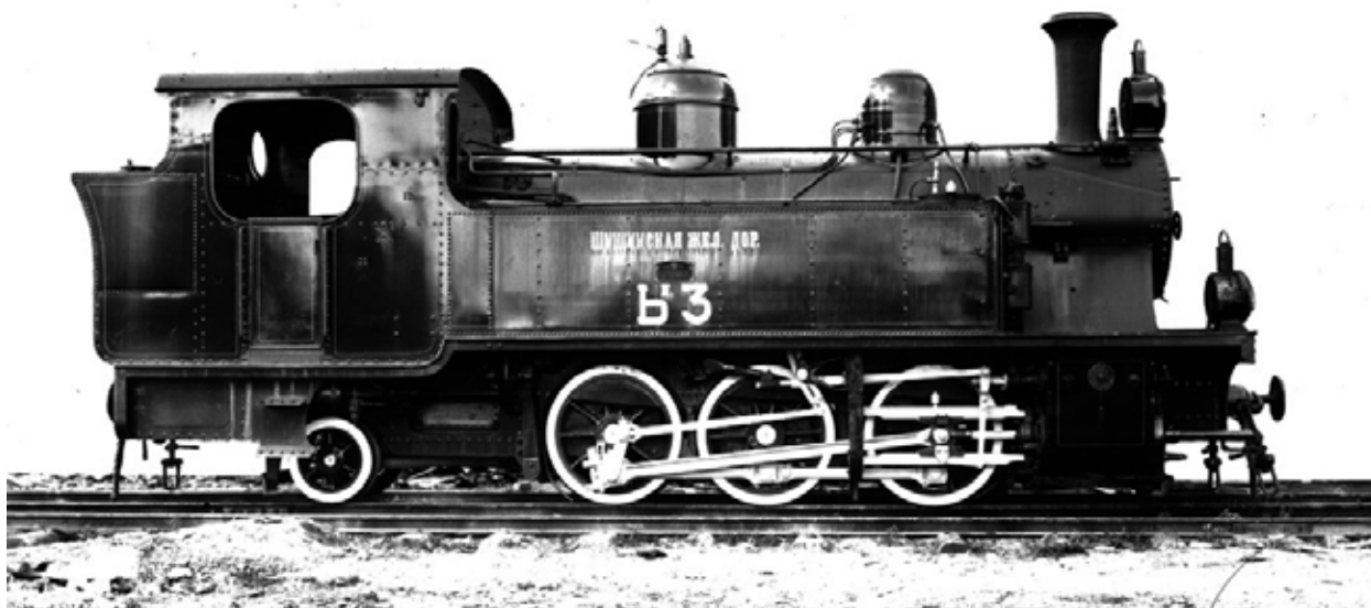
На борту паровоза надпись: "Шушинская железная дорога"

к Биласувару и к станции Прикаспийск, где она должна была соединиться с проектировавшейся веткой Алят – Астара. Указанная линия имела бы протяженность 373 версты, а вместе с боковыми ответвлениями Гянджа – Дашкесан (33 версты) и Тертер – Гасанриз (42 версты), соединительными путями – 458 верст (4, с. 83).