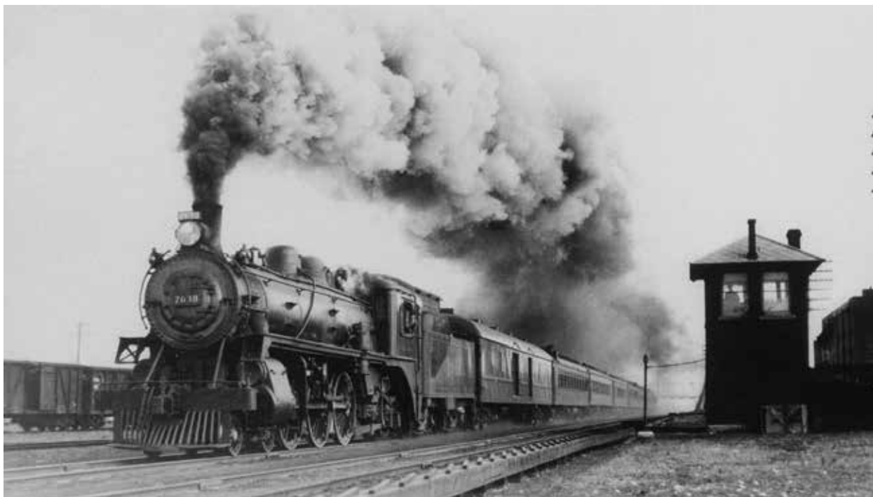
Железные дороги играли большую роль в грузоперевозках

толчком для оживления социально-экономической жизни, развития производительных сил на прилегающих территориях.