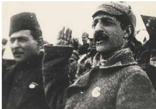
Председатель Совнаркома АзССР Н.Нариманов и член Реввоенсовета Кавказского фронта Г.К.Орджоникидзе на параде войск Красной армии в Баку. 1920 год

В первые годы нефть шла в Армению бесплатно, однако преодолеть топливный голод в стране все не удавалось. Председатель советского правительства Армении А.Мясников в дополнение к отправленным в июне 1921 г. нефтепродуктам просил еще 5 цистерн бензина. Кроме того, постпред Армении в Азербайджане И.Довлатов обратился с письмом в «Азнефть»: «Ввиду переживаемого в Армении острого кризиса с нефтепродуктами, просим Вашего распоряжения об отправке... указанного количества керосина, нефти и бензина в самом срочном порядке, вне всякой очереди» (5). В течение одного только 1921-го года в Армению было бесплатно отгружено 1,6 миллионов тонн нефти (6). В следующем году начальник треста «Азнефть» А.Серебровский подписал с армянским правительством договор сроком до