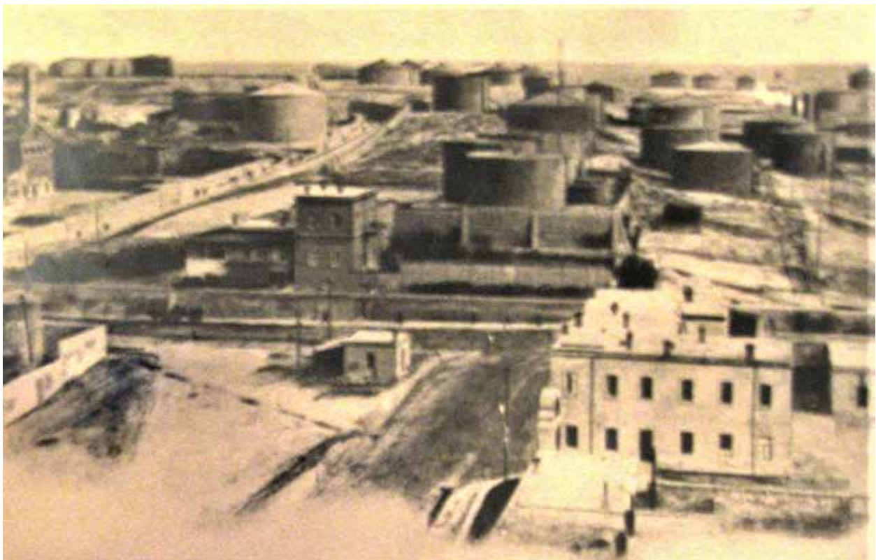
Керосиновые резервуары в "Черном городе" Баку

С целью дальнейшего укрепления контроля над республиками Южного Кавказа большевистское руководство РСФСР поставило задачу объединить их под видом добровольного союза. Еще до советизации Армению и Грузию Россия заключила с советским руководством Азербайджана ряд договоров, предусматривавших слияние различных сфер политической и экономической жизни двух государств. Таким образом, Азербайджан терял и без того урезанную самостоятельность во многих областях, в том числе экономиче-