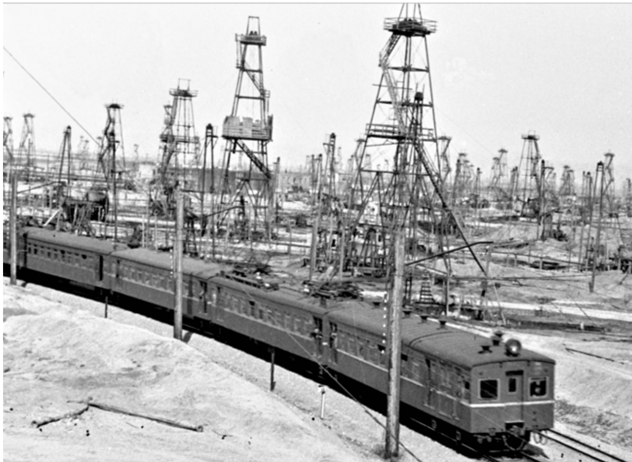
Электропоезд на бакинских нефтепромыслах. Середина 1930-х годов

ской и торговой. Процесс пристегивания республик Южного Кавказа к советской России шел в различных сферах, ведущим же было экономическое направление, в котором Азербайджану с его нефтью отводилась главная роль.