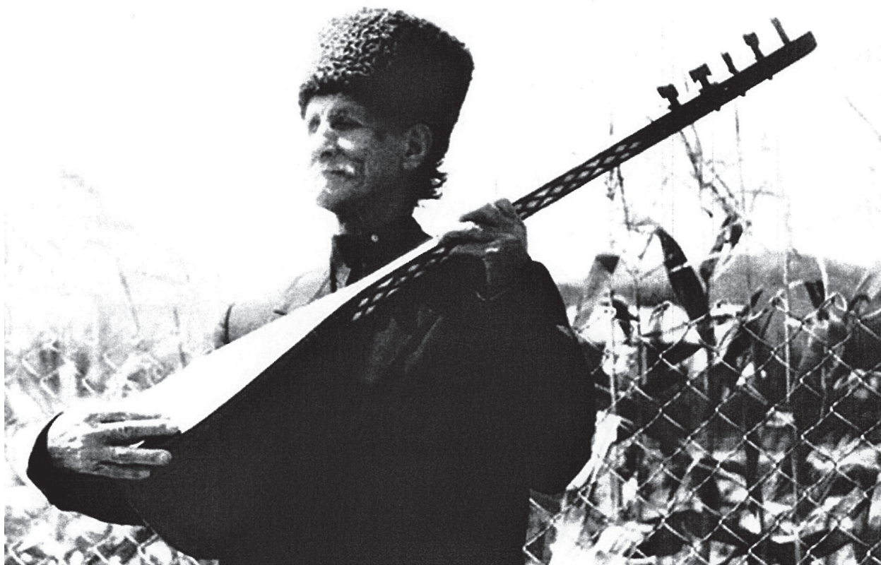
Ашуг Шамшир был певцом красоты родного края

Творчеством Деде Шамшира интересовались яркие представители азербайджанской литературной интеллигенции: Самед Вургун, Осман Сарывелли (1905–1990), Бахтияр Вагабзаде (1925–2009), Чингиз Гусейнов (1929), Сиявуш Мамедзаде (1935), а также Владимир Кафаров (1935–2000) – переводчик и инициатор целого ряда изданий произведений Ашуга Шамшира на русском языке.