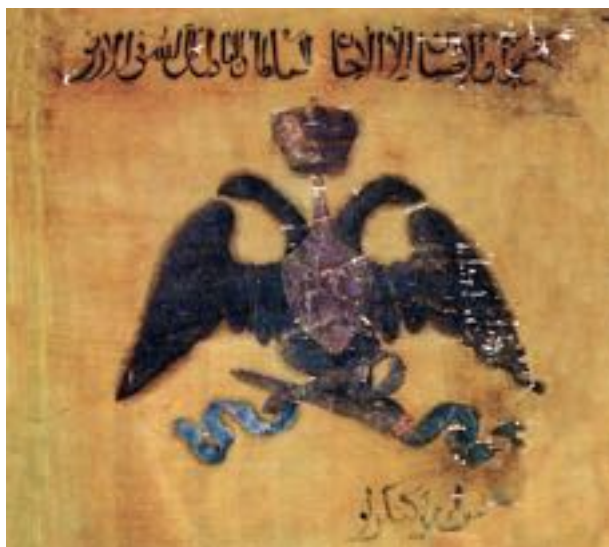
Боевое знамя конницы Кенгерли. НМИА