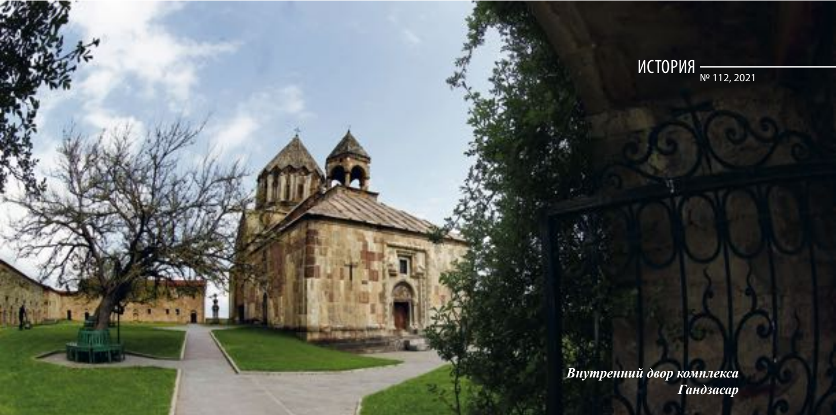
Внутренний двор комплекса Гандзасар

культурной архитектуры соседних стран. В комплекс входит соборная церковь, решенная асимметрично как в объемно-пространственном, так и в планировочном отношении. Своеобразно решена колокольня, возведенная на высоком стилобате, под которым устроен полуциркулярный сводчатый проход.