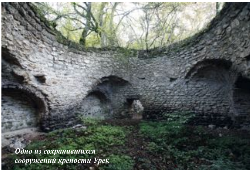
Одно из сохранившихся сооружений крепости Урек

Албании», воздвигнутым для албанского народа. С этого времени монастырь становится резиденцией албанских католиков, которые стали также именоваться и гандзасарскими католиками . В этом монастыре в 1261 г. были похоронены сам Хасан Джалал, а в дальнейшем и его потомки.