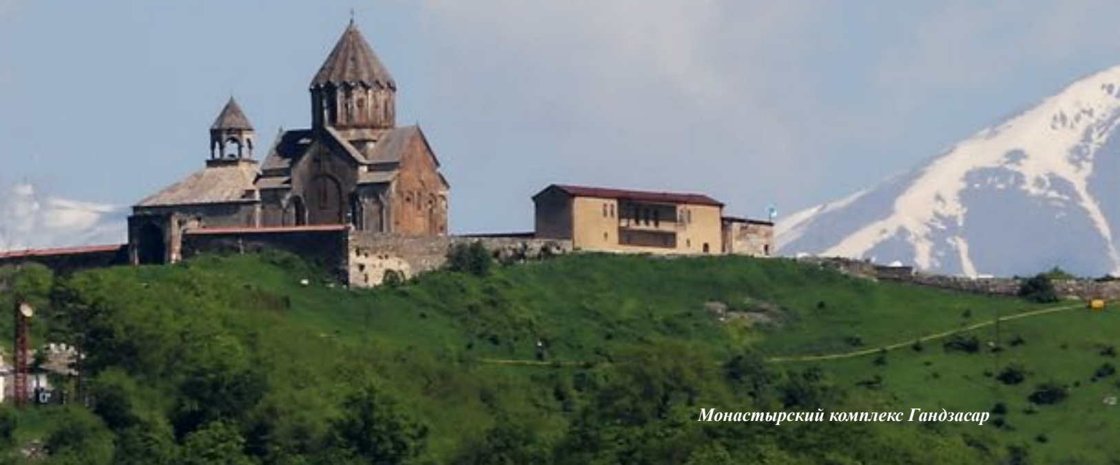
Монастырский комплекс Гандзасар

Наряду с храмами, широкие размеры приняло строительство монастырских комплексов. Вокруг монастырей группировались культурные и учебные учреждения. Монастырские комплексы или отдельные строения строились таким образом, что органично вписывались в окружающий пейзаж, становясь его неотделимой составной частью. Центральным сооружением монастырского комплекса неизменно служил храм , объемом доминируя над остальными строениями. В зависимости от условий местности возводились сопутствующие сооружения - трапезные, скриптории (помещения для хранения и переписи книг), колокольни, жилые и подсобные строения. Как правило, монастырский комплекс обносился прочной каменной стеной, превращаясь в небольшую крепость.