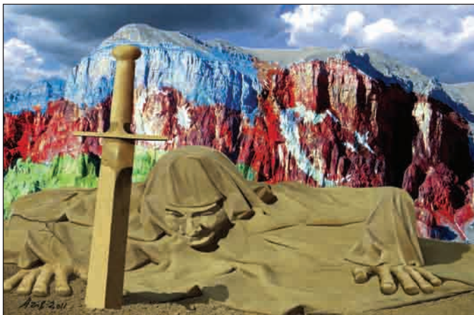
Qalx, ana torpaq