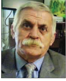
Ziyadxan Əliyev Azərbaycan Respublikasının eməkdar incəsənət xadimi, sənətşünaslıq üzrə fəlsəfə doktoru

Etiraf edək ki, müasir dövrdə həyatımıza daxil olmaqda davam edən yeni texniki avadanlıq və vasitələrdən ən müxtəlif məqsədlər üçün istifadə olunur. Belə vasitələrdən istifadə zamanı çox vaxt xoşagəlməz nəticələrlə də rastlaşırıq. Ancaq insanların bəzən ərsəyə gətirilməsinə çox vaxt sərf etdikləri məsələləri tezləş-