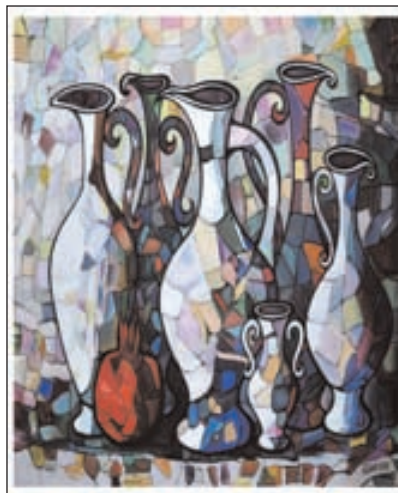
Nar və mis qablar