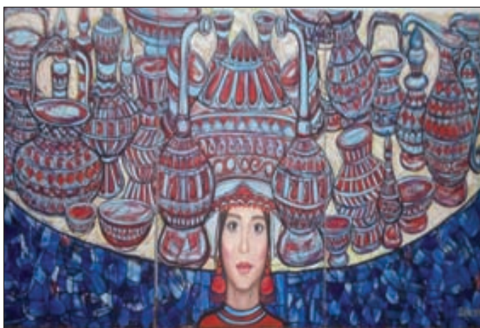
Maddi-mədəniyyət nümunələrimizlə avtoportret

ilk prezidenti Atatürkün adı ilə bağlı 40-dan çox muzeyin olması da bu böyük şəxsiyyətə olan ölçüyəgəlməz el məhəbbətinin göstəricisidir. Ümumxalq sevgisi ilə əhatələnmiş bu muzeylərin ən tanınmışı isə ölkənin paytaxtındakı "Atatürk evi"dir, desək, həqiqəti söyləmiş olarıq.