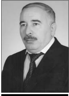
■ ƏBÜLFƏZ ÜLVİ