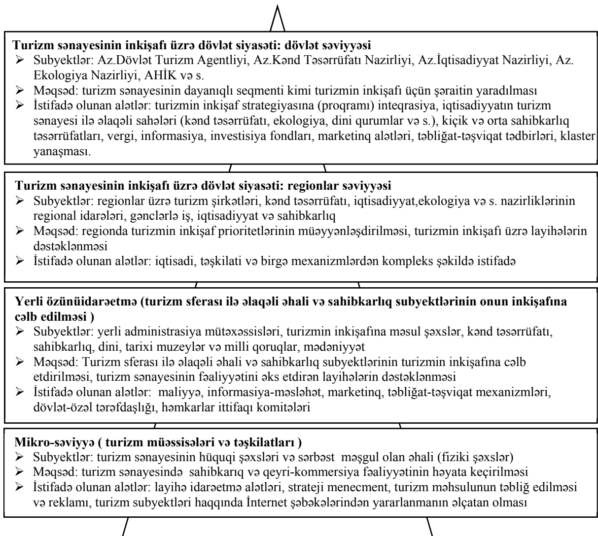
Şəkil 2. Azərbaycanada turizm sənayesinin inkişafı üzrə dövlət siyasətinin təmin edilməsinin təşkilati-iqtisadi mexanizmlərinin əsas alətlər qrupu.

Qeyd: Şəkil müəllif tərəfindən tərtib edilmişdir.