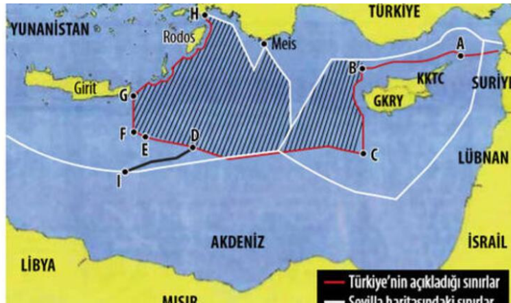
Şəkil 2. Sevillya xəritəsi [11].