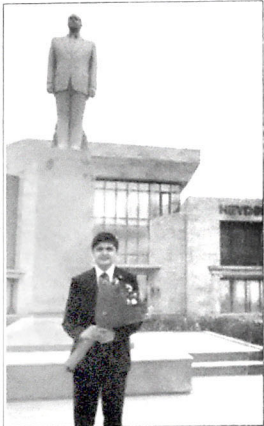
Qarabağ SİKƏSTƏSİ: “Şəki, Şirvan, Qarabağ...” Görən kimin bəstəsi?!” “Şəki, Şirvan, Qarabağ...”

Tarixə bir baxıxdı, Düşüncəmə naxışdı, Birliyə çağırışdı: “Şəki, Şirvan, Qarabağ...”