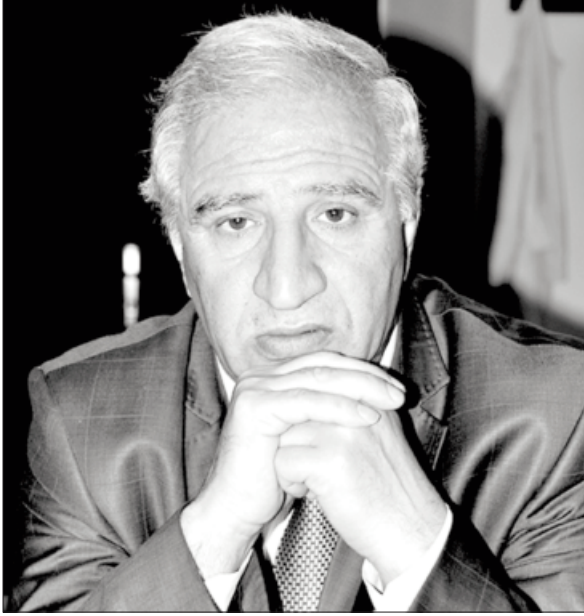
(Əvvəli 1-ci səhifədə)