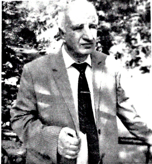
ƏLİ RZA XƏLƏFLİ, Şair-publisist, Beyxəlxalq Rəsul Rza mükafatı laureatı