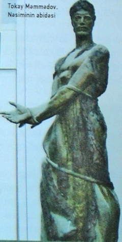
Tokay Məmmədov. Nəsiminin abidəsi

gözələrində xəfif yol keçmiş insanın müdriqliyi görünür. Nəsimi yerin altından çıxaraq bu dünyanın gedişatına baxır. Onun allərinin yana açılması sanki bu dünyanın işlərinə təəccüb qalmasına bir işarədir. Şairin baş geyimi, güclə sezişən qırışları, alnı sənətkarlıqla rəsm edilmişdir. Göz yuvalarının, şişmiş göz qapaqlarının, dartılmış qaşların bu cür incə nüanslarla verilməsi şairin dünyanın gedişatını xəyal aləmində fikirləşməsini çox aydın şəkildə ifadələyir. Nəsiminin mənalı, nüfuzedicı baxışı şəhərdə gəzən insanlara dikilmişdir. Psixoloji baxımdan ifadəli bir heykəlin yaranmasında işıq-kölgənin rolu böyükdür. Tunc gözəl plastik xassələrə malikdir və günəşin şüaları altında bərq vuraraq xüsusilə böyük bir effekt yaradır. Kölgə şairin gözələrinin qeyri-adi biçimini, burun dəliklərini, biq və saqqal xətlərini nəzərə çəpdirərək böyük mərdlik və mənəvi əzəmət təsiri oyatmağa yardımçıdır. Şairin çiyinə sallanan çalma bir haşiya əmələ gətirir, heykəl və xətlərin aydınlığı və dəqiqliyi, siluətin gözəlliyi ilə fərqlənir. Heykəltəraş geyimin gözəl və ifadəli olmasına, qatların bir-birinə bacarıqla uyğunlaşdırılmasına böyük əhəmiyyət vermiş və bılərdən əbətin ön hissəsini açıq qoyaraq onun bədənini göstərməklə tamaşaçıya bildirmək istəmişdir ki, şairin dərisi paltar kimi əynindən soyularaq çıxarılmışdır. Əbətin quruluşu əbətin şaquli kompozisiyasının yuxarı doğru istiqamətliyini aydın göstərmək