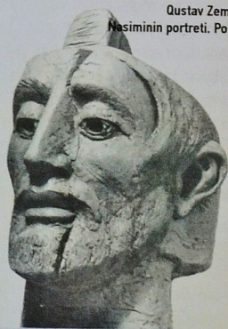
Qustav Zemla. Nəsiminin portreti. Polşa

yetirib. Birinci portreti (1970) tamamlayan heykəltəraş sonradan tapdığı bədii-estetik xüsusiyyətləri şairin fiqurunda (1971) verə bilməmişdir. Fuad Bakıxanov Nəsimi ünvanlı əsərlərində gəniş bədii ümumiləşdirmələrdən istifadə ilə hürufi şairin orijinal obrazını yaratdı. Bu özünəməxsusluğu şərtləndirən başlıca bədii xüsusiyyət, əqidə dönməzliyi ilə əbədiyyət qazanan hürufi şairin ənənəviləşdirilən zahiri görkəmi üçün orijinal forma-biçim həlli tapa bilməsidir.