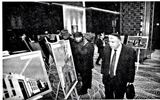
Konfrans çərçivəsində Azərbaycanın tarixi-dini abidələrinin fotolarından ibarət sərgi təşkil olunub

Sülh, əməkdaşlıq naminə bir araya gələn ölkələr və dinlər arasında ünsiyyət platformasının daha da dərinləşdirilməsi istiqamətində müzakirələrlə başa çatan konfransdan sonra yerli və beynəlxalq mətbuat nümayəndələri üçün brifinq keçirilib, jurnalistləri maraqlandıran suallar ətrafı cavablandırılıb.