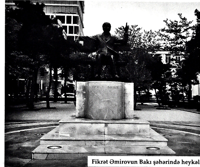
Fikrət Əmirovun Bakı şəhərində heykəli

2011-ci ildə Bakı şəhərində Fikrət Əmirovun əbədləşdirilməsi məqsədilə heykəli qoyulmuşdur. Həmin heykəlin müəllifi Namiq Dadaşovdur.