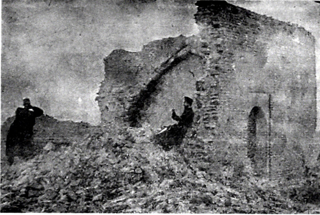
Müsiqə dövrümüzdə dahi şairin türbəsinə aid foto.

Fikrət Əmirov "Gülüm", Şəfiqə Axundova "Nə gözəl", "Nizami necə səbr etsin əzizim", Ağabacı Rzayeva "Könlüm", Hacı Xanməmmədov "Surəti canan", Adil Gəray "Yar gəlmiş idi", Cahangir Cahangirov "Gül camalın", Süleyman Ələsgərov "Sərvixuramanım mənəm", Sevda İbrahimova "Tez gəl", "Səninlədir mənəm canım", Hökümə Nəcəfova "Yarım gəldi", Ceyhun Allahverdiyev "Nədəndir, "Dilbər" kimi romas və ariyaları bəstələmişdirlər.