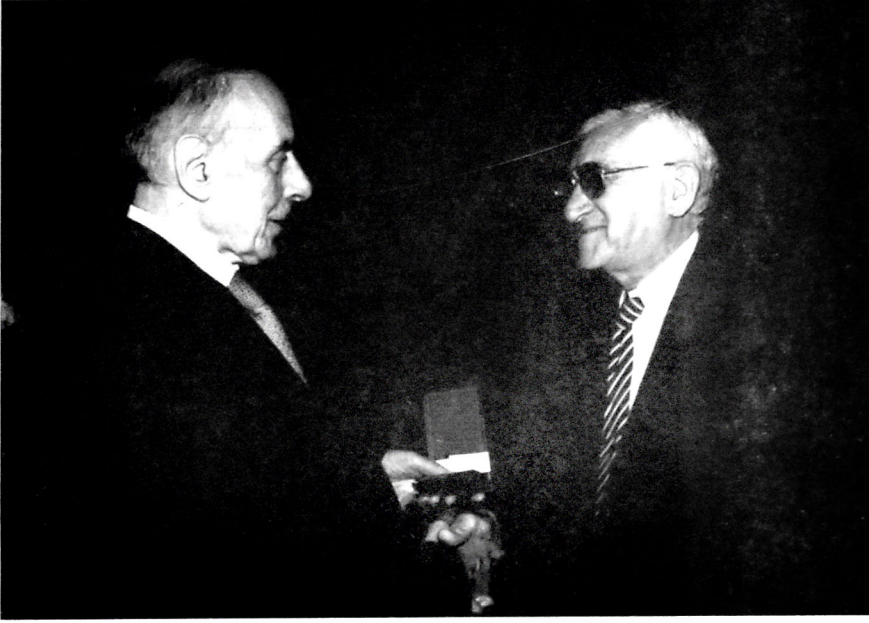
Heydər Əliyev və Tofiq Bakıxanov

Üzeyir bəy 1920-30-cu illər Sovet İttifaqı məkanındakı adla deyilən, bilikli, təcrübəli musiqiçi və musiqişünasları Azərbaycana dəvət etməklə, nəhənglərin ortaq gücü ilə mükəmməl bir musiqi tədrisi şəbəkəsi yaratmaqla, lap əvvəldən yeni pərvəriş tapan müasir Azərbaycan bəstəçiliyi və ifaçılığına Şərq-Qərb vəhdətini başlıca ülgü olaraq müəyyənləşdirməklə, qabiliyyətli gənclərə bir övlad sevgisi ilə yanaşaraq onları sonsuz qayğıkeşliklə yetişdirməklə millətimizə misilsiz bir yol bağışladı.