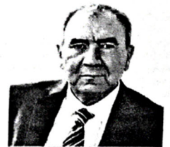
Professor Cəmil Həsənlı