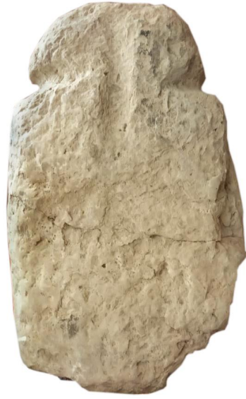
Şəkil 2. II Kultepe (e.ə.II minillik) Foto müəllifindir