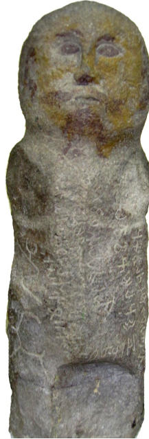
Şəkil 8. MONQOLUSTAN. Ulan- Bator Tarix Muzeyi. VI əsr.