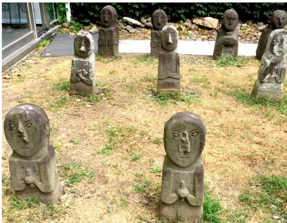
Şəkil 10. Cənubi Koreya. XIV əsr