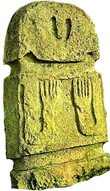
Şəkil 4.e.ə.VII-VI yüzilliklər