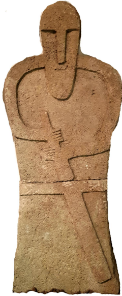
Şəkil 5. Az.Tarixi Muzeyi (e.ə.III- eramızın II əsri).