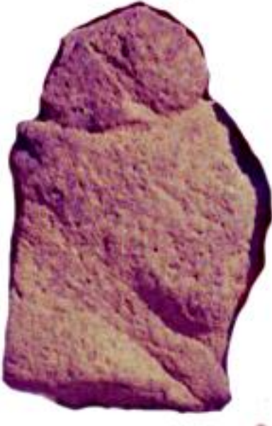
Şəkil 1. Maxta (e.ə.III minillik)