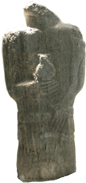
Şəkil 7. Altay. VII-XI əsrlər.