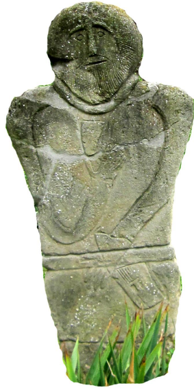
Şəkil 6. MOLDOVA. Kişinyov Tarix Muzeyi.(e.ə.V-IV əsrlər).