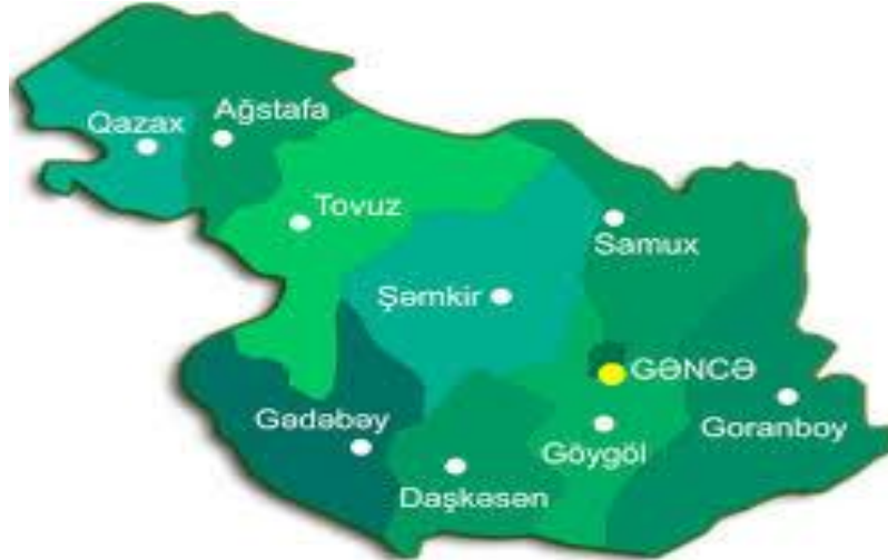
Şəkil 1. Gəncə-Qazax iqtisadi – coğrafi rayonunun xəritəsi.

Gəncə-Qazax iqtisadi rayonu respublikamızın qərbində yerləşməklə olduqca əlverişli iqtisadi-coğrafi mövqeyə malikdir. İqtisadi rayonun ümumi sahəsi 12,48 min km 2 olmaqla ölkə ərazisinin 14,4 faizini təşkil edir. Gəncə-Qazax iqtisadi rayonu Ağstafa, Daşkəsən, Gədəbəy, Goranboy, Göygöl, Qazax, Samux, Şəmkir, Tovuz rayonlarını, Gəncə və Naftalan şəhərlərini əhatə edir. Həmin rayon və şəhərlər inzibati ərazi vahidlərinə, şəhər, qəsəbə və kənd yaşayış məntəqələrinə bölünür. İqtisadi rayonda 12 şəhər, 9 rayon, 2 şəhərdaxili rayon, 42 qəsəbə, 279 kənd inzibati ərazi vahidləri və 521 kənd yaşayış məntəqələri vardır. 01 yanvar 2012-ci ilin əvvəlinə olan məlumata görə, Gəncə-Qazax iqtisadi rayonunun əhalisi 1205,2 min nəfər və ya ölkə əhalisinin 13,1 faizini təşkil etmişdir. Regionun əhalisinin 46,3 faizi şəhərlərdə, 53,7 faizi isə kəndlərdə yaşayır [1].