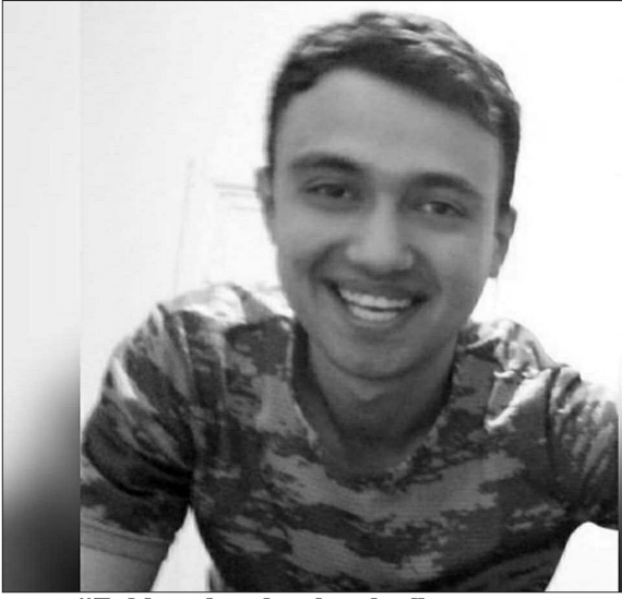
"Zabit qabaqda olar deyib, könüllü XTQ-yə qoşuldu"

"Şəhidlər ölməz, vətən bölünməz", - deyiblər. Müdrik ifadədir. Torpağı bölünməyə qoymayan igid, ərən oğullarımız var və heç zaman Odlar Diyarı parçalanmaz, yağının işğalında qalmaz. Özü də sayı minlərlə, milyonlardır ərənlərimizin. "Vətən dardadır" sözünü eşidər-eşitməz onun səsinə səs verib, bu torpağın hər qarışı var olsun, - deyər, onu qanları ilə suvaran oğulların diyarı olan bu məmləkət heç zaman basılmaz. 44 günlük Vətən müharibəsində torpaq uğurunda mücadiləyə qalxaraq, erməni işğalında olan torpaqlarımızın azad olunması yolunda odalov içinə atılan övladlarımızla yaşadığımız yüzilliyin Zəfər tarixini yazdılar. Müharibənin dəhşətlərinin nə olduğunu bilsələr də Azərbaycan Prezidenti, Ali Baş Komandanın çağırışına cavab olaraq, bir yumruq ətrafında birləşdilər. Sanki bu günü çoxdan gözləyirmiş kimi. Bəli, bütün vətən övladları bu çağırışı səbirsizliklə gözləyirdilər. Buna ac, möhtac idilər. Axi, işğalda olan əzəli torpaqlarımız öz sakinlərinin yolunun səbirsizliklə gözləyirdi. Dövlət başçısının həyata keçirdiyi siyasət nəticəsində hər açılan günümüz bizi bu torpaqlara bir addım da yaxınlaşdırırdı.